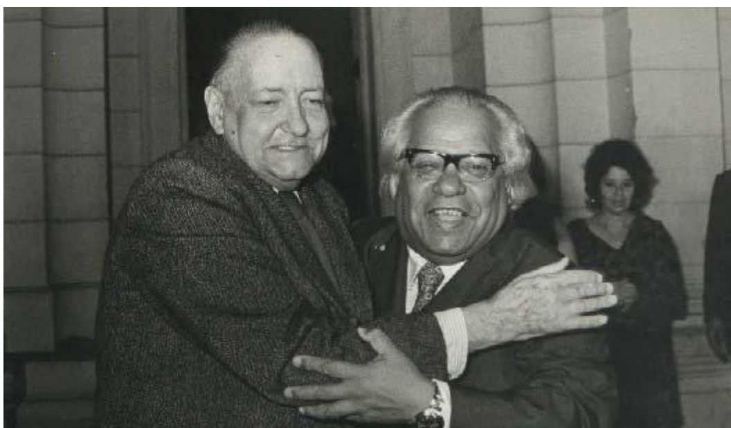
Carpentier (l) y Guillén, icónicas figuras de las letras cubanas dan nombre a dos importantes premios literarios.

La Habana, 20 dic (RHC) La Editorial Letras Cubanas y el Instituto Cubano del Libro anunciaron este martes los ganadores de los premios literarios 'Alejo Carpentier' y 'Nicolás Guillén', correspondientes a 2022, los cuales reconocen la obra ensayística, poética y narrativa.