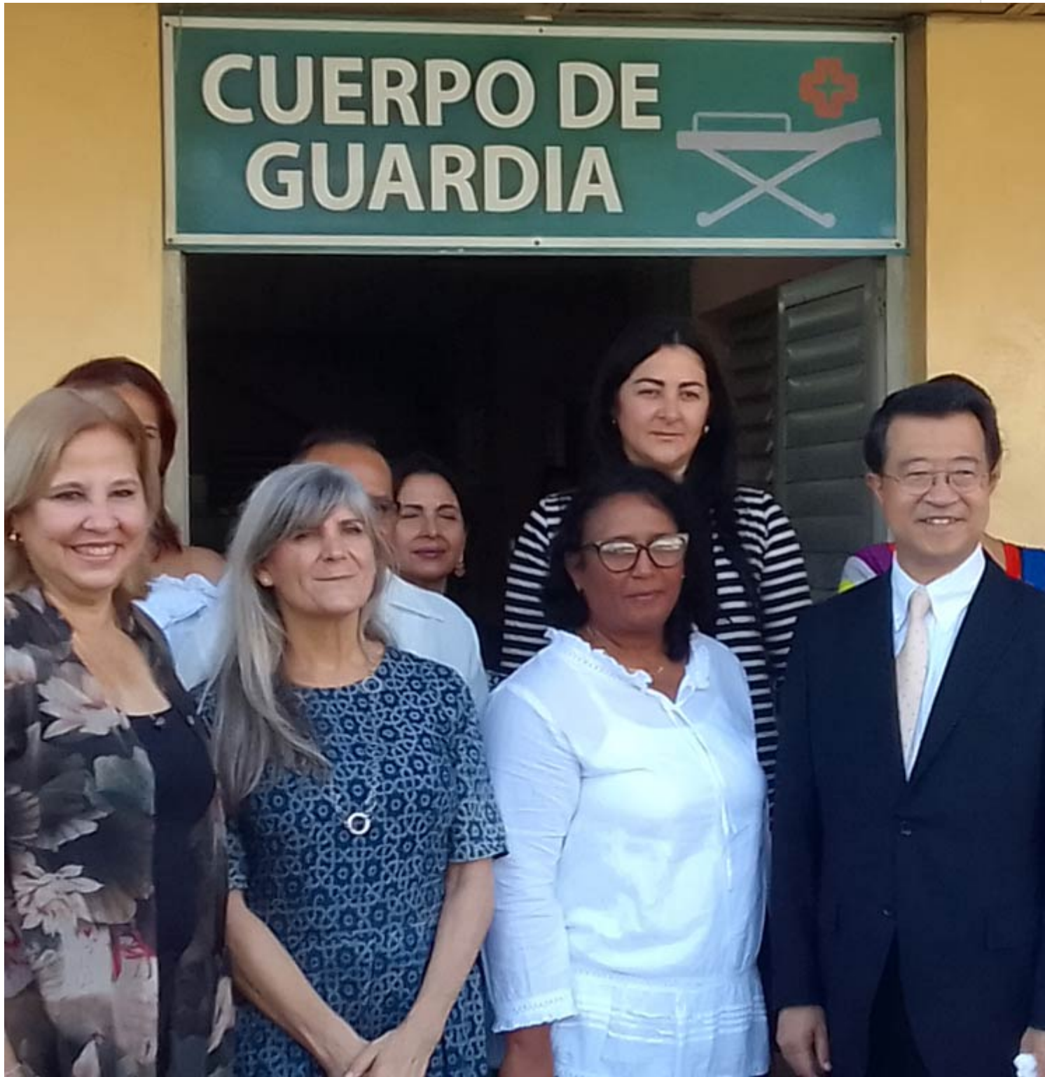
La Havane, 21 déc (RHC) La polyclinique "Lidia y Clodomira" de la municipalité de Regla, à La Havane, a reçu mercredi un don d'équipement médical du Japon et du Fonds des Nations Unies pour l'enfance (Unicef), destiné à renforcer les capacités sanitaires pour faire face au Covid-19 à Cuba.