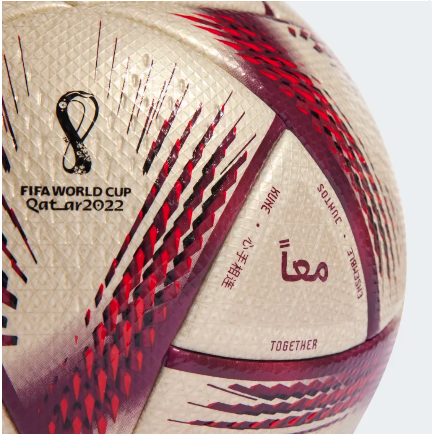
Al-hilm kun Esperanto-teksto: Kune

Pluraj esperantistoj sukcesis uzi la novaĵon pri Al Hilal por informi pri Esperanto, en personaj retoj aŭ per agado de gazetaroj. UEA gratulas al tiuj kaj kuraĝigas ilin daŭre reprodukti la informojn nacilingve ankaŭ okaze de la apero de Al Hilal. UEA rememorigas, ke Tutmonda Esperanta Futbala Asocio (TEFA), kvankam ne aliĝinta al FIFA, estas ekde 2014 membro de la NF-Ligo (ne-FIFA-Ligo), kiu kunigas teamojn de neagnoskitaj ŝtatoj, de minoritataj grupoj aŭ senŝtatajn teamojn, kiel la futbalteamon Esperanto, de TEFA mem.