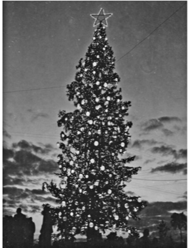
Árbol de navidad de Fontanar

Quizás muchos recuerden aún el arbolito del reparto Fontanar, que se convertía, para grandes y chicos, en uno de los espectáculos más atractivos de fin de año.