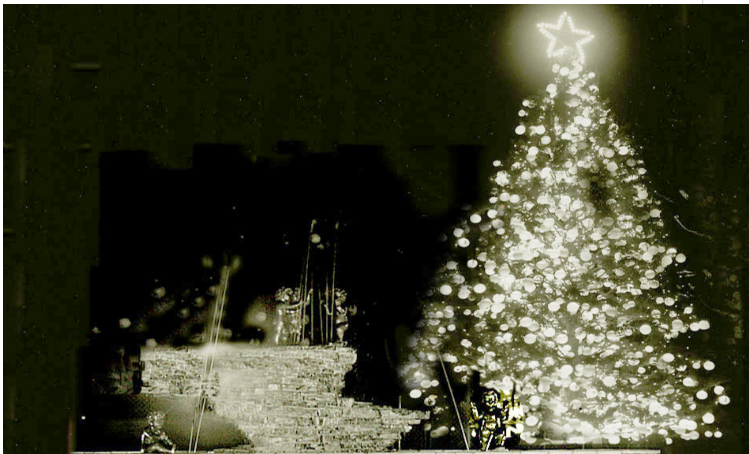
Árbol de Navidad gigante en el reparto Fontanar

El reparto Fontanar se erigió, a partir de 1956, en los terrenos de la finca San José o Retiro de Vento, dedicada a la siembra de la caña de azúcar para el central Toledo.