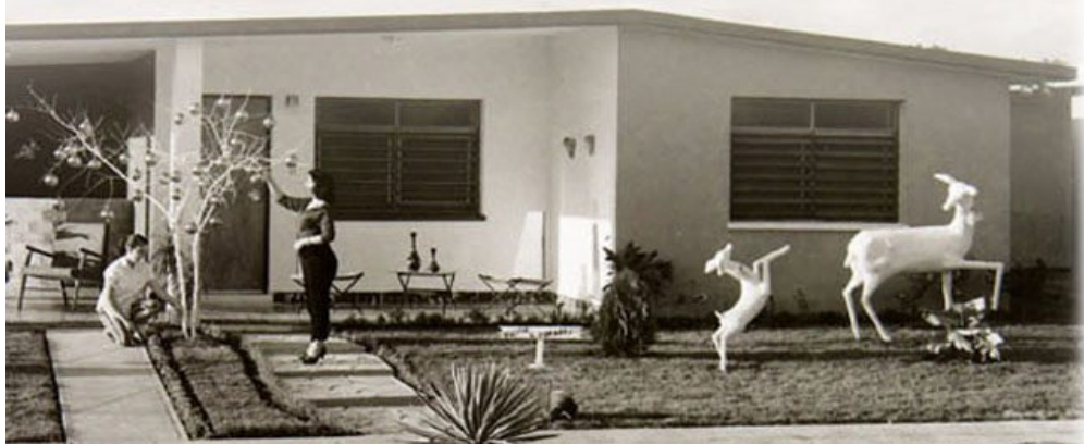
Árbol de Navidad gigante en Fontanar

Pronto Fontanar cobró auge al convertirse en sitio preferido por actores, periodistas, celebridades de la radio y la televisión que fabricaron allí su vivienda.