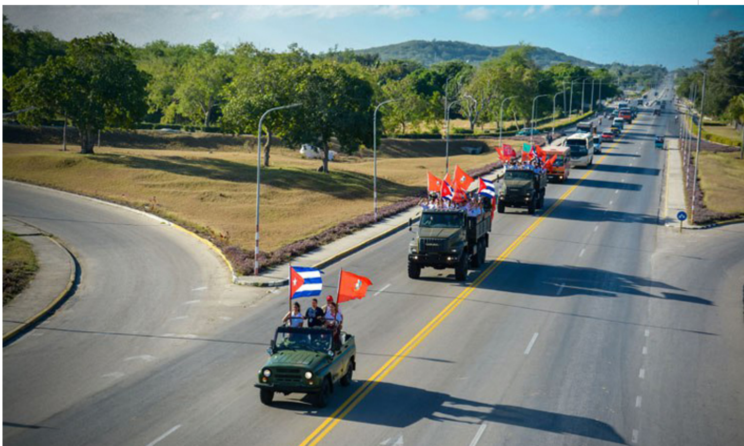
Caravana de la Libertad en tránsito por la oriental provincia de Holguín.

Holguín, 3 ene (RHC) Varias generaciones de holguineros conmemoraron este martes en esa ciudad oriental el tránsito de la Caravana de la Libertad, en el aniversario 64 del hecho histórico que, en 1959, llevó a Fidel Castro y el Ejército Rebelde desde Santiago de Cuba hasta La Habana.