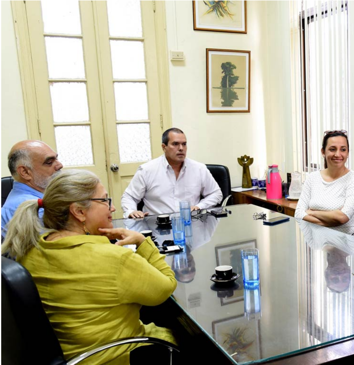
Le coprésident de la Fondation Miguel Angel Asturias en visite à Prensa Latina

La Havane, 6 janvier (RHC) La Fondation Miguel Angel Asturias du Guatemala et l'agence de presse Prensa Latina ont convenu vendredi de renforcer leurs liens et de coopérer à la promotion de l'œuvre et de la pensée du prix Nobel de littérature 1967.