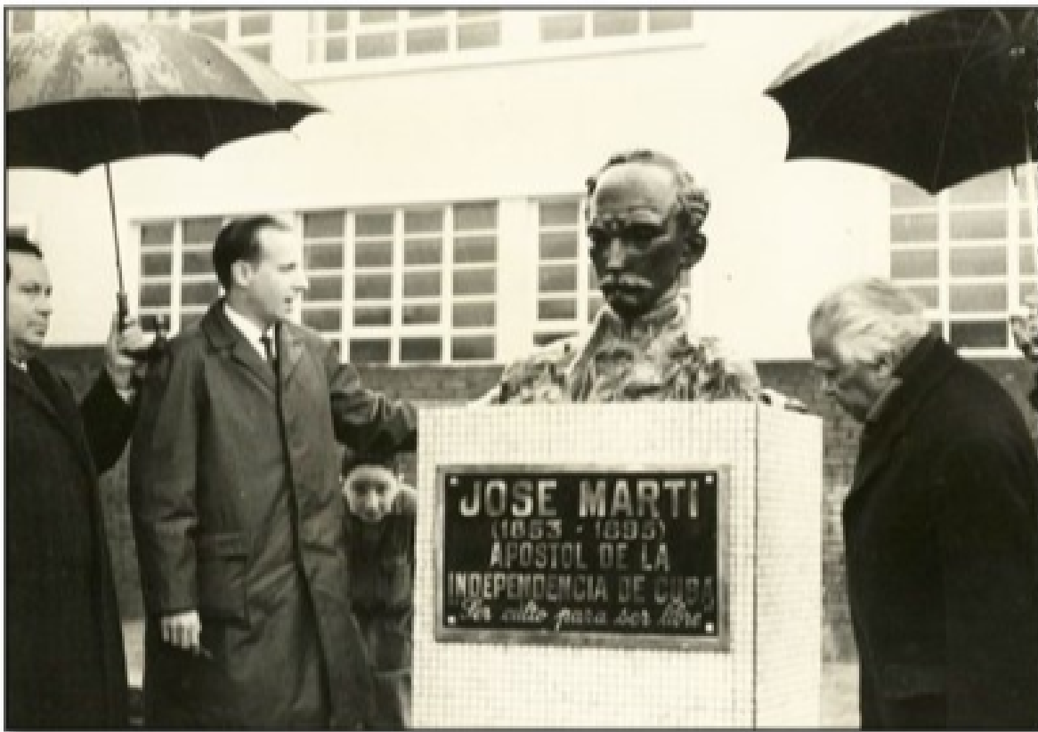
Inaugurando con Nicolás Guillén en 1963 una escuela donada por Cuba a los pobladores mineros de Lota, en Chile