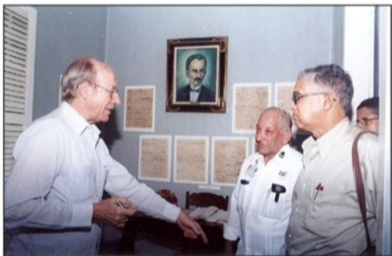
En casa museo que evoca encuentro entre Máximo Gómez y José Martí en Montecristi, República Dominicana en 2008.