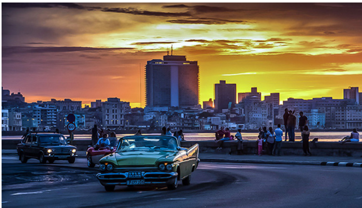
Coucher de soleil sur le Malecon de La Havane.

(Avec des informations du New York Times et de Prensa Latina).