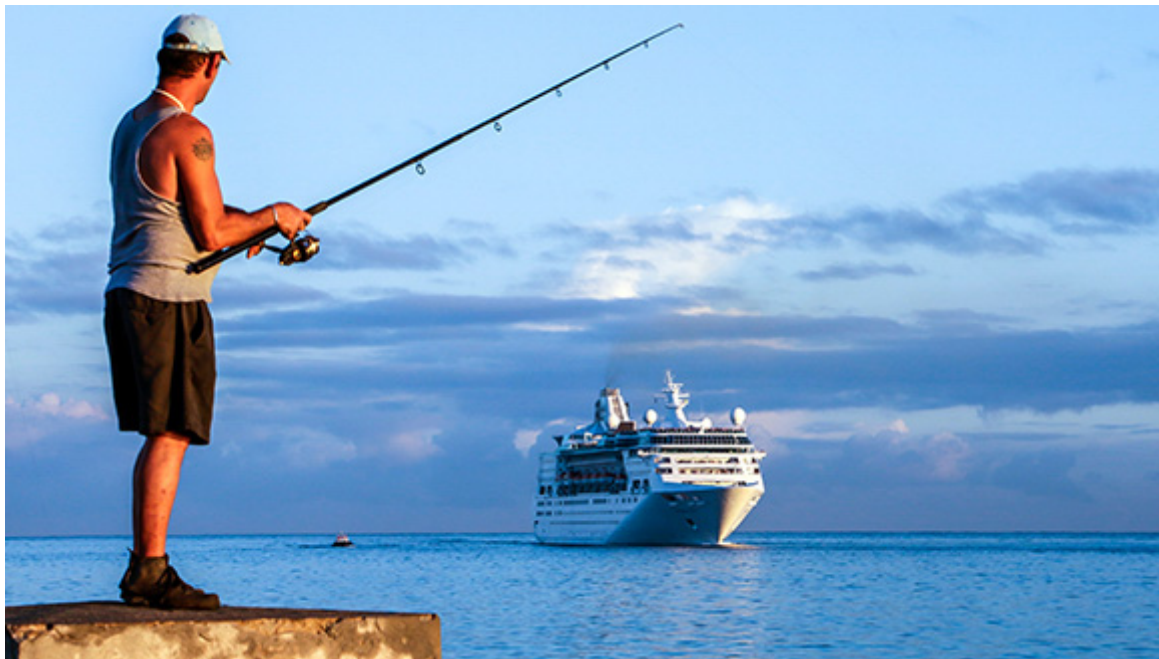
Privilèges de la pêche sur le Malecon (la promenade du bord de mer) de La Havane.

Ce n'est pas la première fois que la plus grande île antillaise apparaît sur les listes de suggestions du New York Times, et en 2016, la vallée de Viñales, dans la province occidentale de Pinar del Río, a également été classée 10e dans une liste de 52 destinations pour les voyageurs.