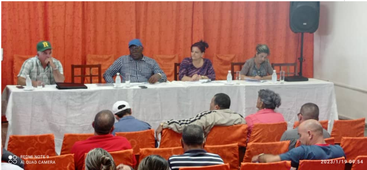
Valdés Mesa en Pinar del Río.

Pinar del Río, 19 ene (RHC) Salvador Valdés Mesa, Vicepresidente de Cuba, comenzó este jueves una visita de trabajo a la occidental provincia de Pinar del Río, para evaluar tareas de importancia en el territorio.