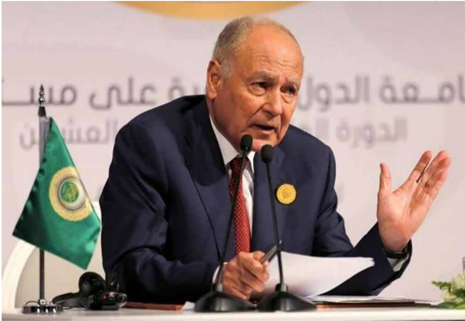
Secretario general de la Liga Árabe, Ahmed Aboul Gheit.

El Cairo, 23 ene (Prensa Latina) El secretario general de la Liga Árabe, Ahmed Aboul Gheit, denunció este lunes la quema de un Corán, libro sagrado de los musulmanes, durante una protesta en Estocolmo, Suecia, al señalar que tales actos deben ser rechazados por todos.