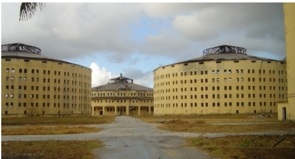
Presidio Modelo.