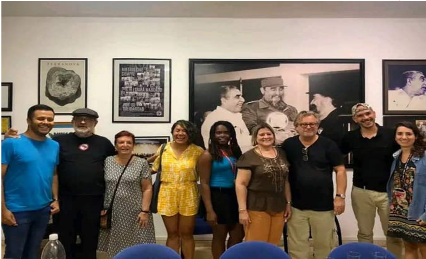
Bent Hamer en La Habana.