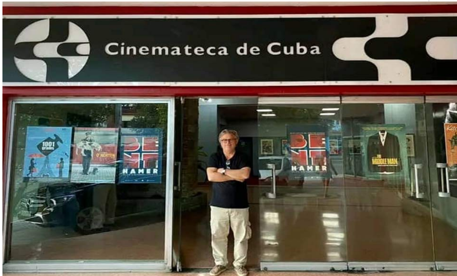
Bent Hamer en la Cinemateca de Cuba.

ciclo homenaje organizado por la Cinemateca de Cuba, en esta capital, 8 al 11 de febrero; también para impartir una clase magistral en la Escuela Internacional de Cine y Televisión, y concedió amable esta entrevista.