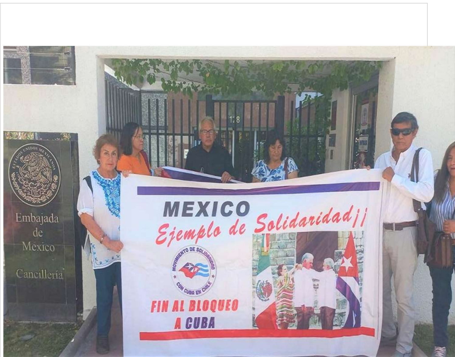
Integrantes del movimiento chileno de solidaridad con Cuba.

Santiago de Chile, 15 feb (RHC) El movimiento chileno de solidaridad con Cuba entregó este miércoles una carta en la embajada de México, donde reconoce el apoyo del presidente Andrés Manuel López Obrador a la causa contra el bloqueo a la nación caribeña.