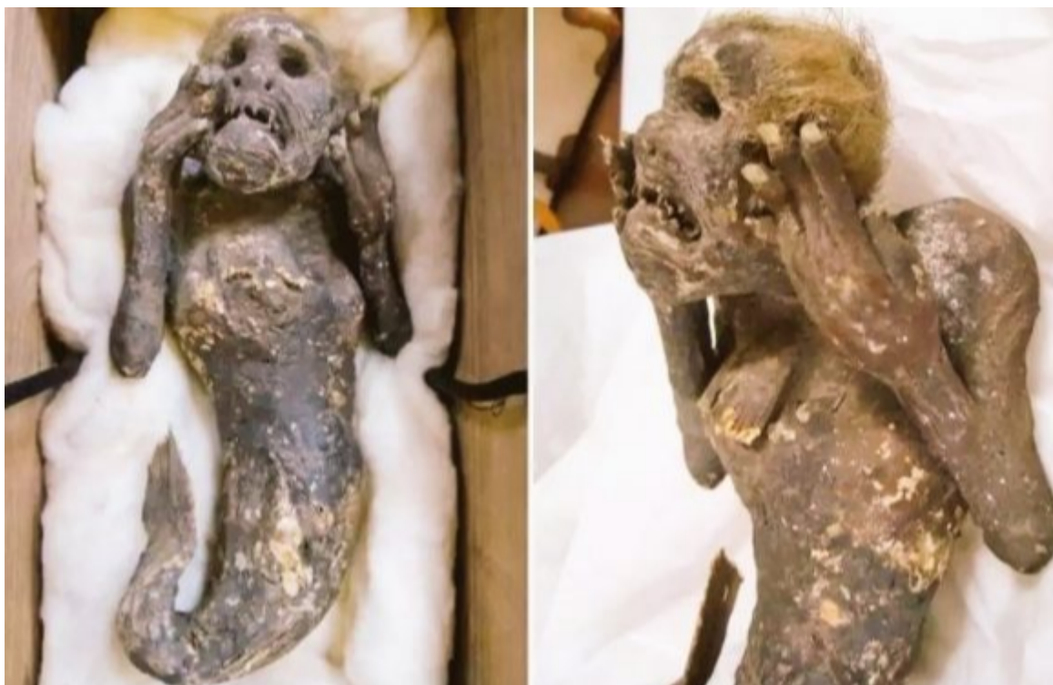
La momia se consideraba una reliquia sagrada.

Una extraña momia encontrada en una red de pesca en el siglo XIX en Japón ha sido venerada durante décadas en el templo Enjuin, pues se consideraba una reliquia sagrada, y aunque se pensaba que era una combinación de mono y pez, científicos ya pudieron revelar de qué está hecha la criatura.