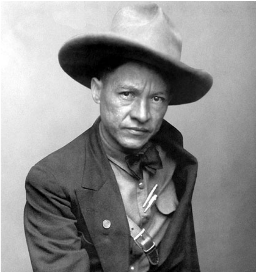
El Héroe Nacional de Nicaragua, Augusto César Sandino, "General de Hombres Libres"

Luego de la sesión en el Legislativo, diputados de la bancada sandinista, el canciller Denis Moncada, miembros del Parlamento Centroamericano por Nicaragua, entre otros invitados, depositaron flores ante el monumento a los generales en esta capital.