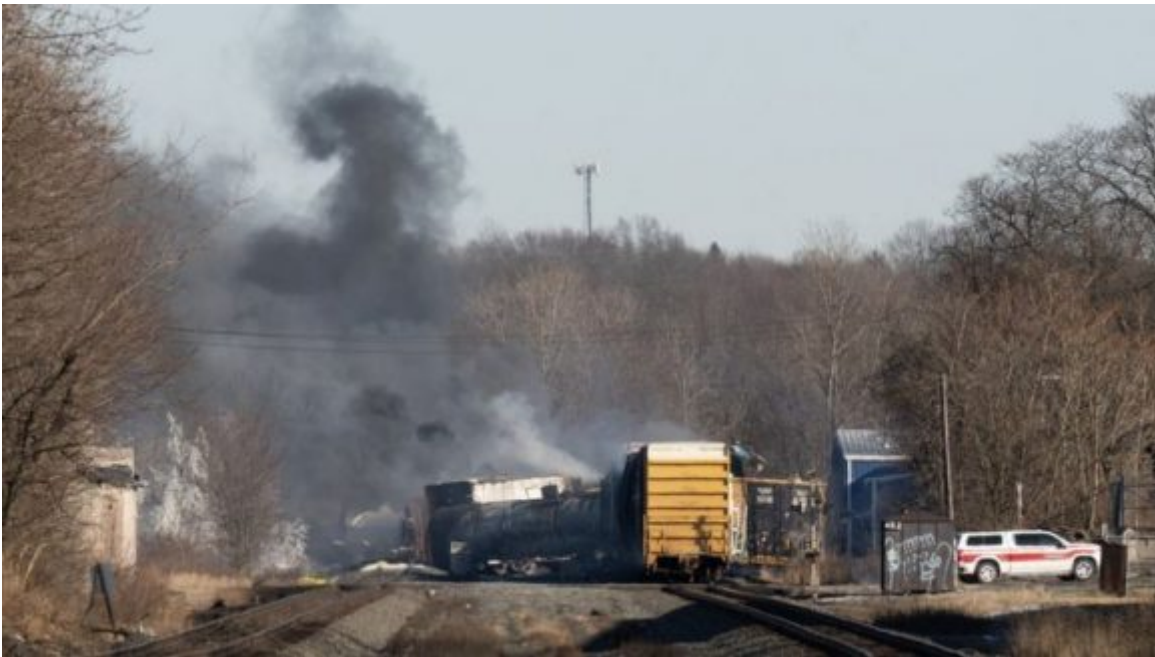
Un tren de carga que transportaba productos químicos peligrosos descarrila en East Palestine, Ohio.

Empleados de la compañía, bajo anonimato, revelaron la semana pasada a CBS que el vehículo experimentó fallos mecánicos dos días antes del descarrilamiento y que transportaba una carga exagerada: 151 vagones, entre ellos una veintena con elementos nocivos, para un peso total de unas 18 000 toneladas.