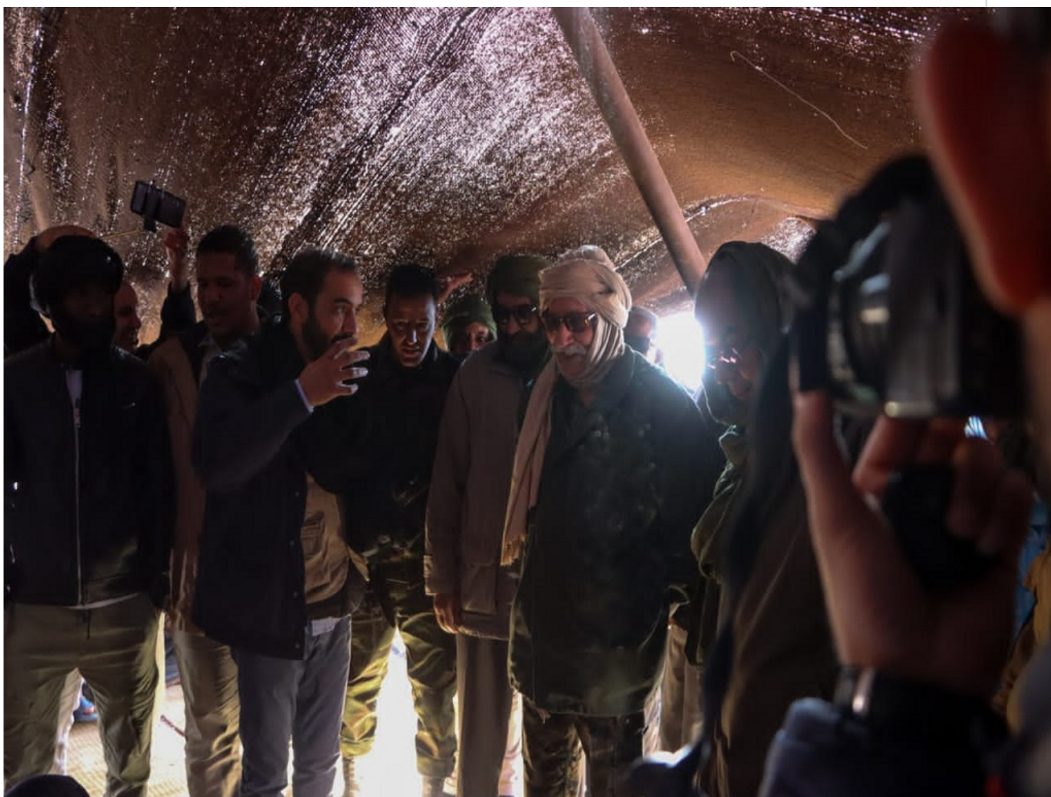
Brahim Ghali durante la inauguración del Frig (conjunto de jaimas).