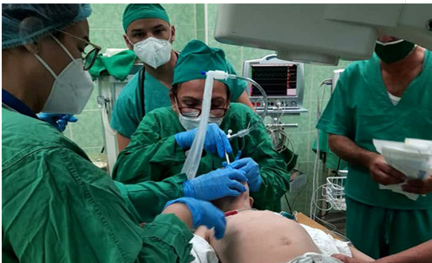
Médicos cubanos extraen clavo alojado en el pulmón derecho a niño en Holguín.

Holguín, 7 mar (RHC) Un equipo multidisciplinario de expertos del Hospital Pediátrico Octavio de la Concepción y de la Pedraja, salvó este fin de semana la vida de un niño con un clavo alojado en el pulmón derecho, tercera urgencia médica de esta naturaleza en esa institución en lo que va de año.