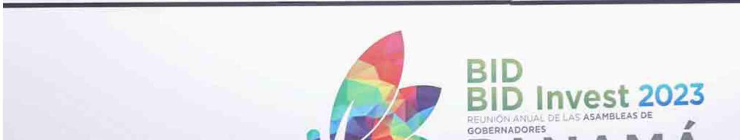
63 Reunión del Banco Interamericano de Desarrollo en Ciudad de Panamá.

Ciudad de Panamá, 18 mar (RHC) Panamá asumió este sábado, por un año, la presidencia de las Asambleas Anuales de Gobernadores del Banco Interamericano de Desarrollo (BID), cuya sesión plenaria abrió sus puertas en esta capital.