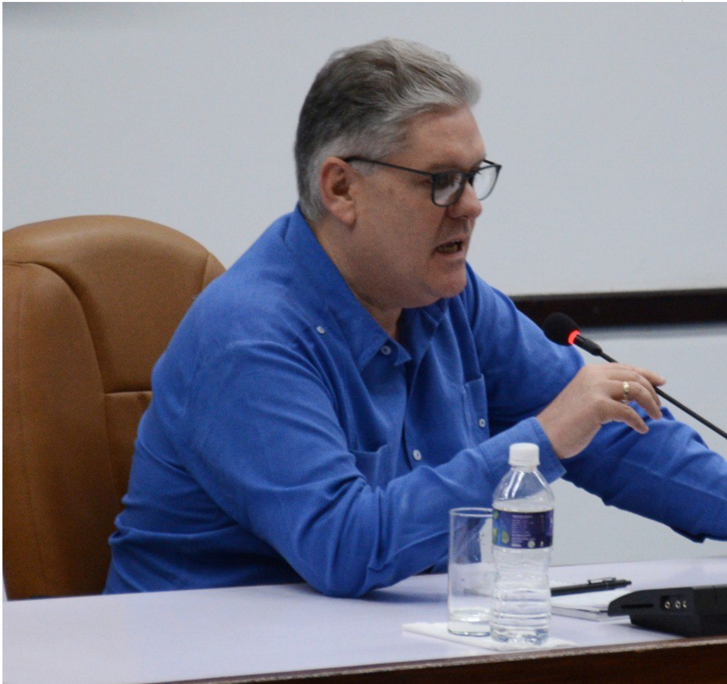
Alejandro Gil

Le vice-premier ministre de la République, Alejandro Gil Fernández, ministre de l'Économie et de la Planification, et le ministre des Finances et des Prix, Meisi Bolaños Weiss, d'autres cadres, ainsi que des membres du Comité central du Parti communiste de Cuba, participent également à la réunion de travail (Source : ACN).