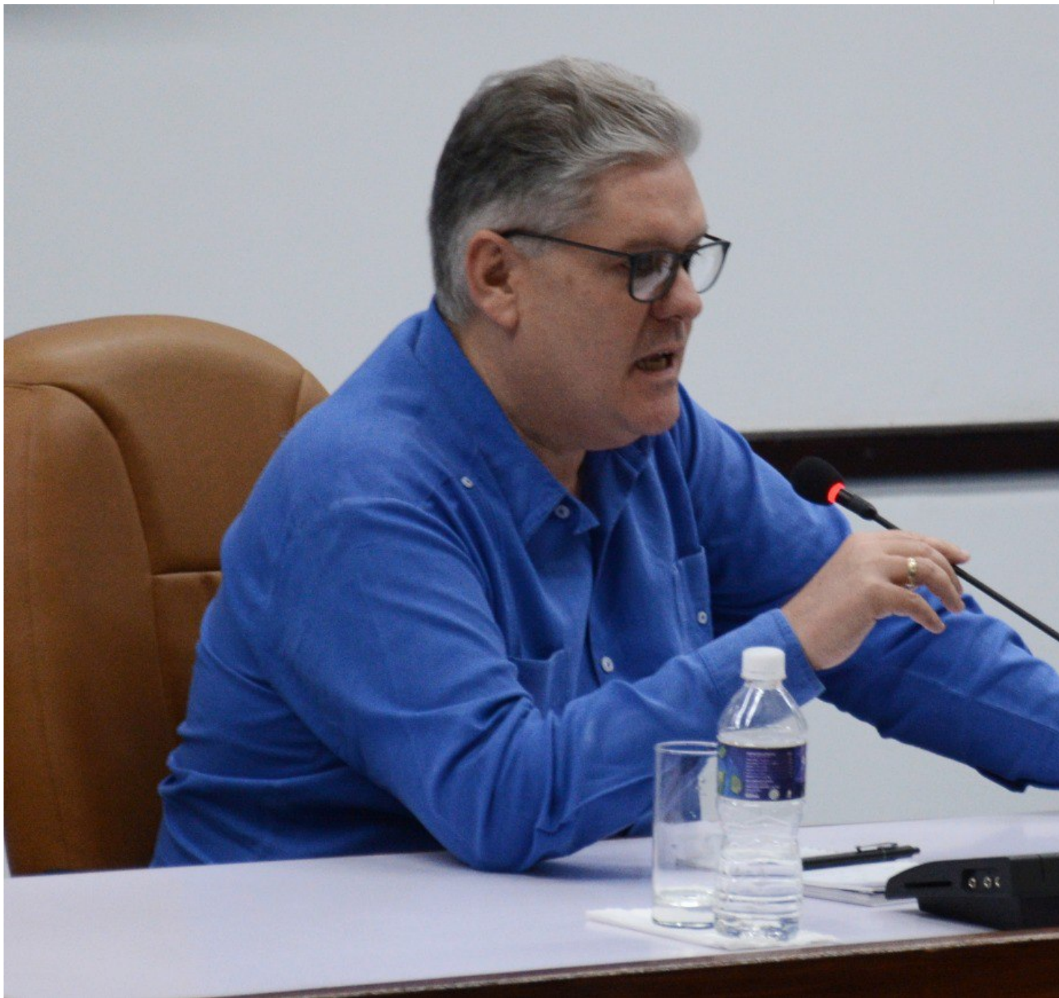
Alejandro Gil

Le vice-premier ministre de la République, Alejandro Gil Fernández, ministre de l'Économie et de la Planification, et le ministre des Finances et des Prix, Meisi Bolaños Weiss, d'autres cadres, ainsi que des membres du Comité central du Parti communiste de Cuba, participent également à la réunion de travail (Source : ACN).