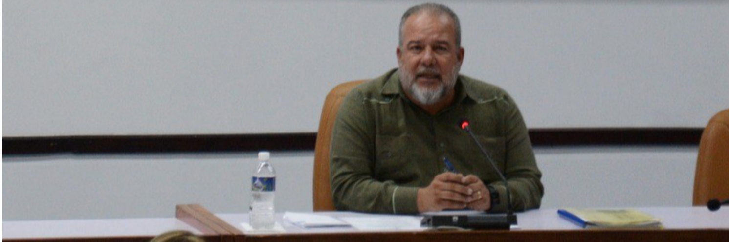
La Havane, 4 avril (RHC) Le Premier ministre cubain Manuel Marrero Cruz (photo) participe ce mardi au bilan annuel du Ministère des Finances et des Prix (MFP).