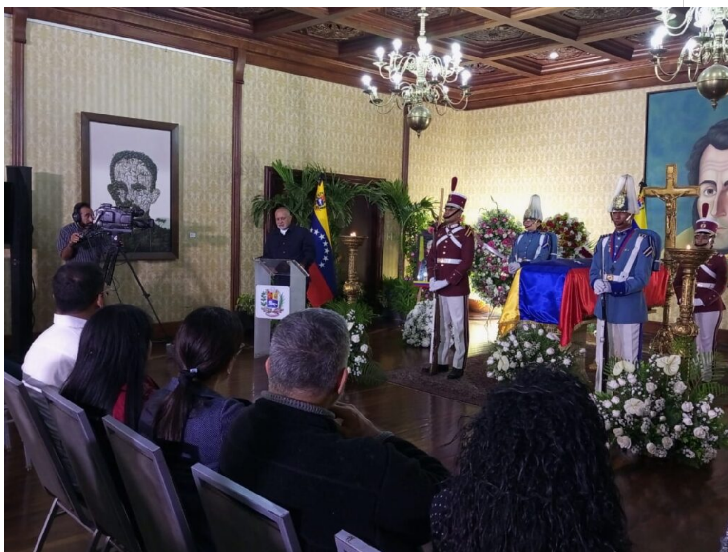
Diosdado Cabello, miembros de la Dirección Nacional del PSUV rindieron honores a Tibisay Lucena.