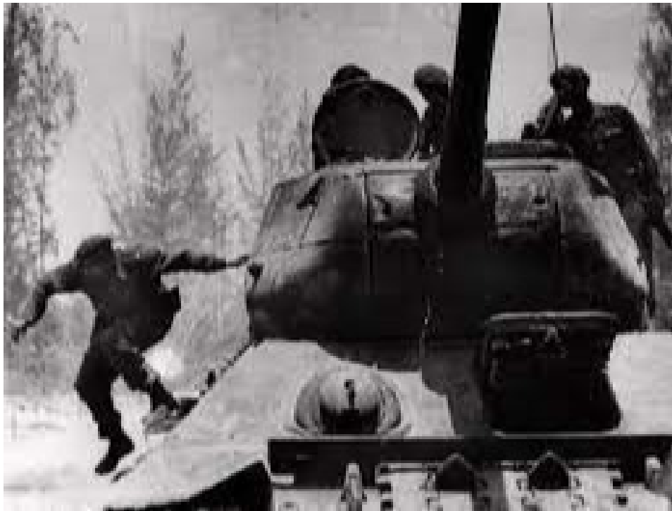
Fidel desciende de un tanque en Playa Girón.

En la madrugada del 17 de abril se produjo la invasión mercenaria por el sur de la antigua provincia Las Villas. Integraron el contingente invasor, 1 500 hombres y traían el propósito de establecer una cabeza de playa y constituir un gobierno provisional contrarrevolucionario que solicitaría y obtendría de inmediato la intervención de los Estados Unidos.