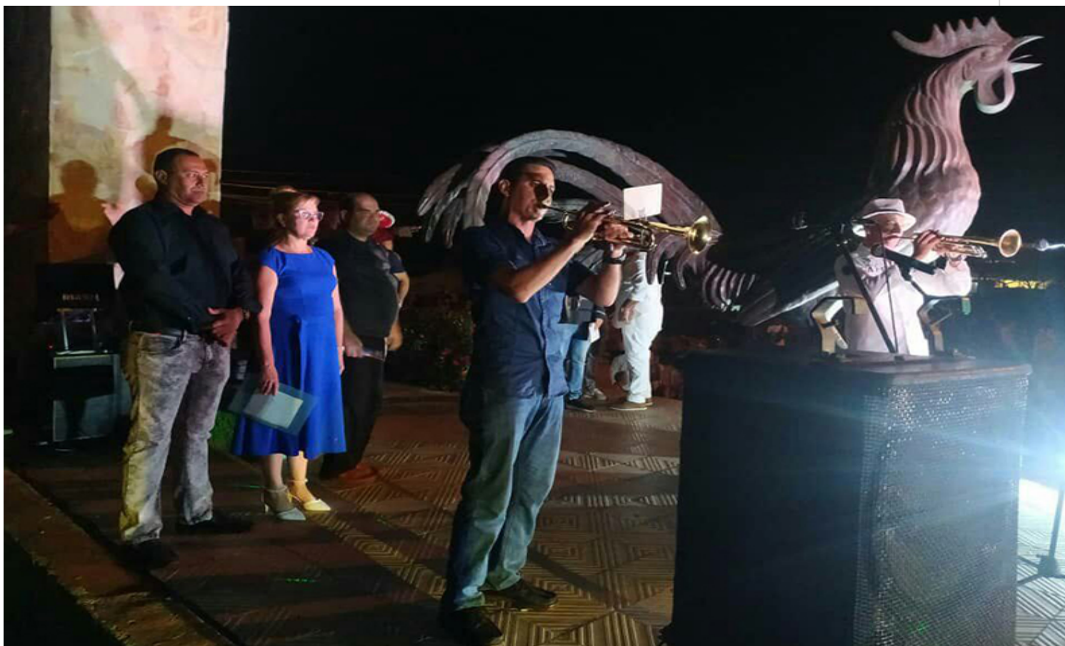
Serenata al Gallo de Morón.

promover distintas manifestaciones del arte en la localidad.