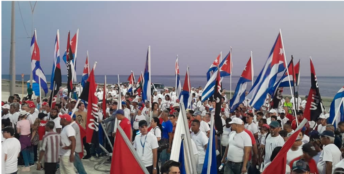
Amigos extranjeros, junto a trabajadores cubanos condenaron el bloqueo de EE.UU. a la isla.