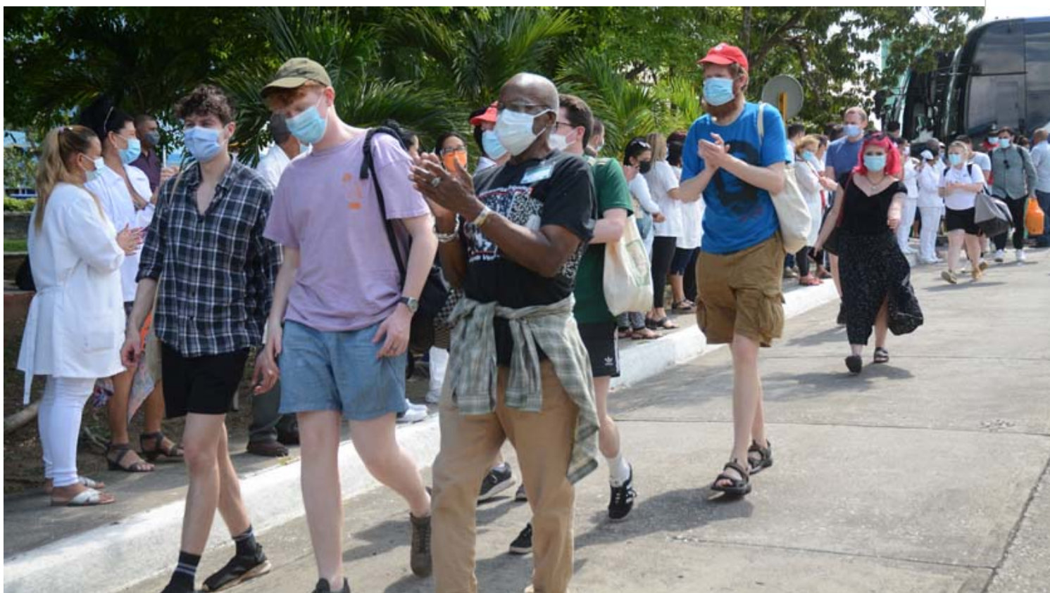
Integrantes del XVI Contingente de la Brigada Internacional Primero de Mayo, de Trabajo Voluntario y Solidaridad con Cuba.

Sancti Spíritus, 7 may (RHC) Gratamente impresionados quedaron los integrantes del XVI Contingente de la Brigada Internacional Primero de Mayo, de Trabajo Voluntario y Solidaridad con Cuba, que desde el pasado miércoles permanecieron en la provincia de Sancti Spíritus.