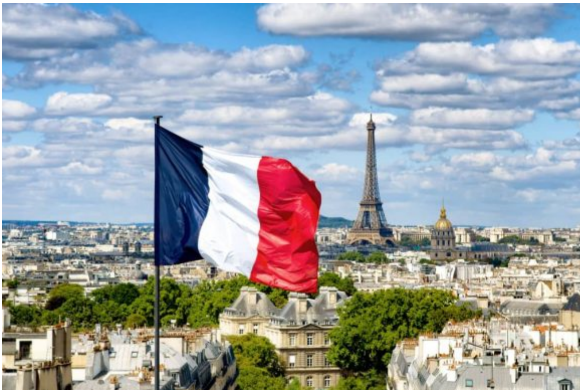
Cultura francesa.

El mes de la cultura francesa surgió desde 2015 por iniciativa de François Hollande, expresidente de esa nación, tras su visita oficial al archipiélago.