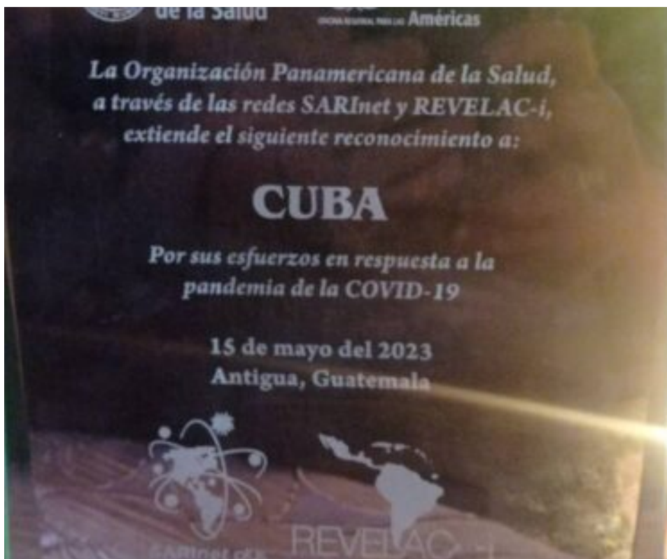
Distinción a la mayor isla del Caribe.

Ciudad de Guatemala, 16 may (RHC) La Organización Panamericana de la Salud (OPS), a través de sus redes Sarinet y Revelac, extendió en Guatemala un reconocimiento a Cuba por sus esfuerzos en respuesta a la Covid-19, trascendió este martes.