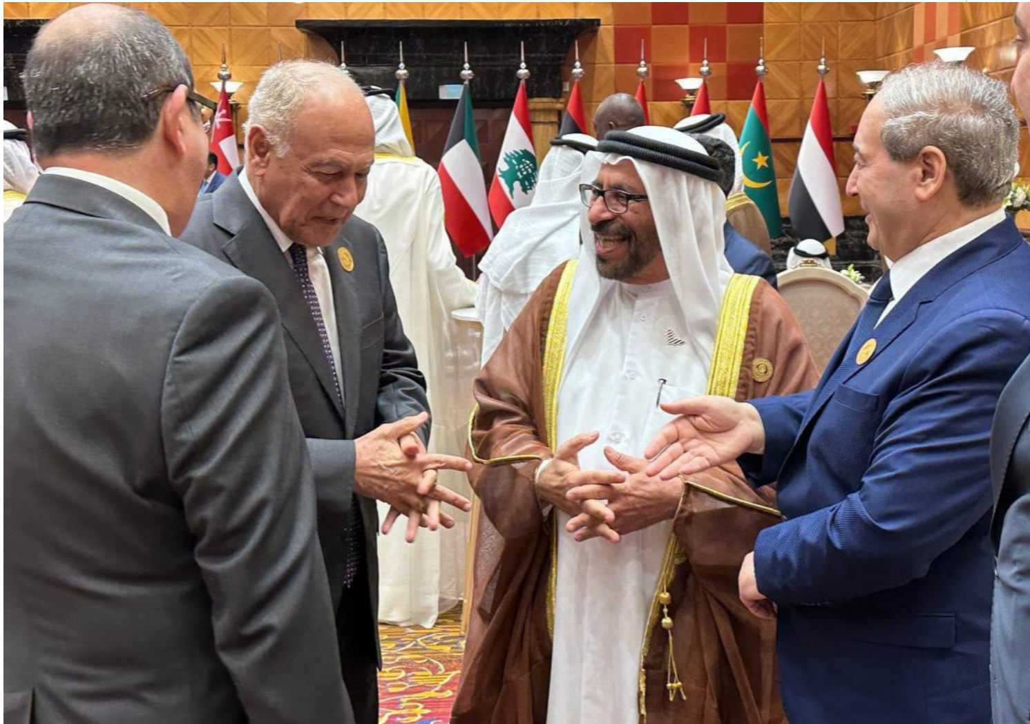
Siria participa por primera desde hace 12 años en la Reunión de Cancilleres Árabes.

Damasco, 17 may (RHC) El ministro de Asuntos Exteriores de Siria, Faisal Al-Mekdad, sostuvo este miércoles encuentros con varias de sus homólogos de diferentes países árabes, informaron medios de prensa.