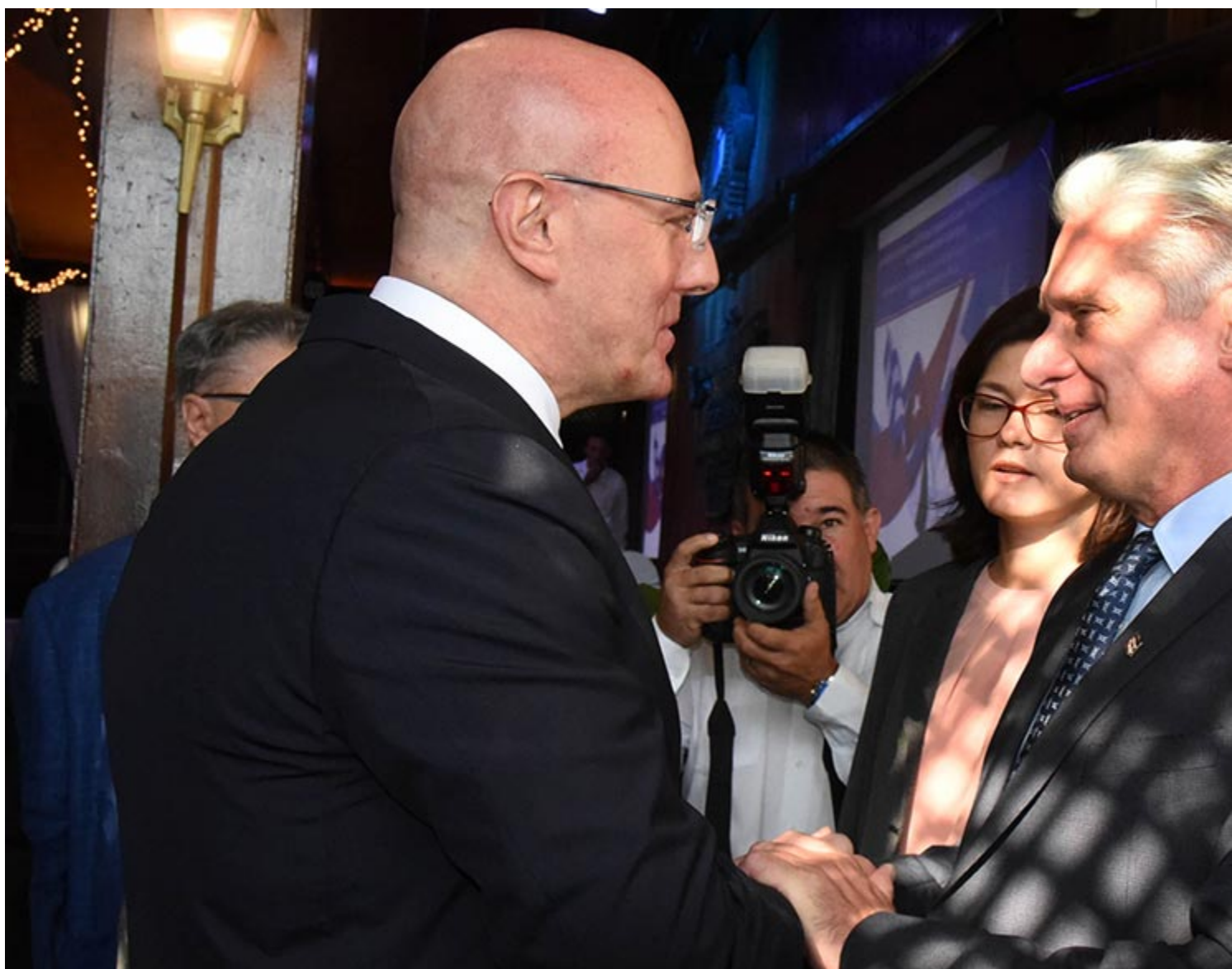
Chernyshenko (G) se réjouit de l'accueil du président cubain.