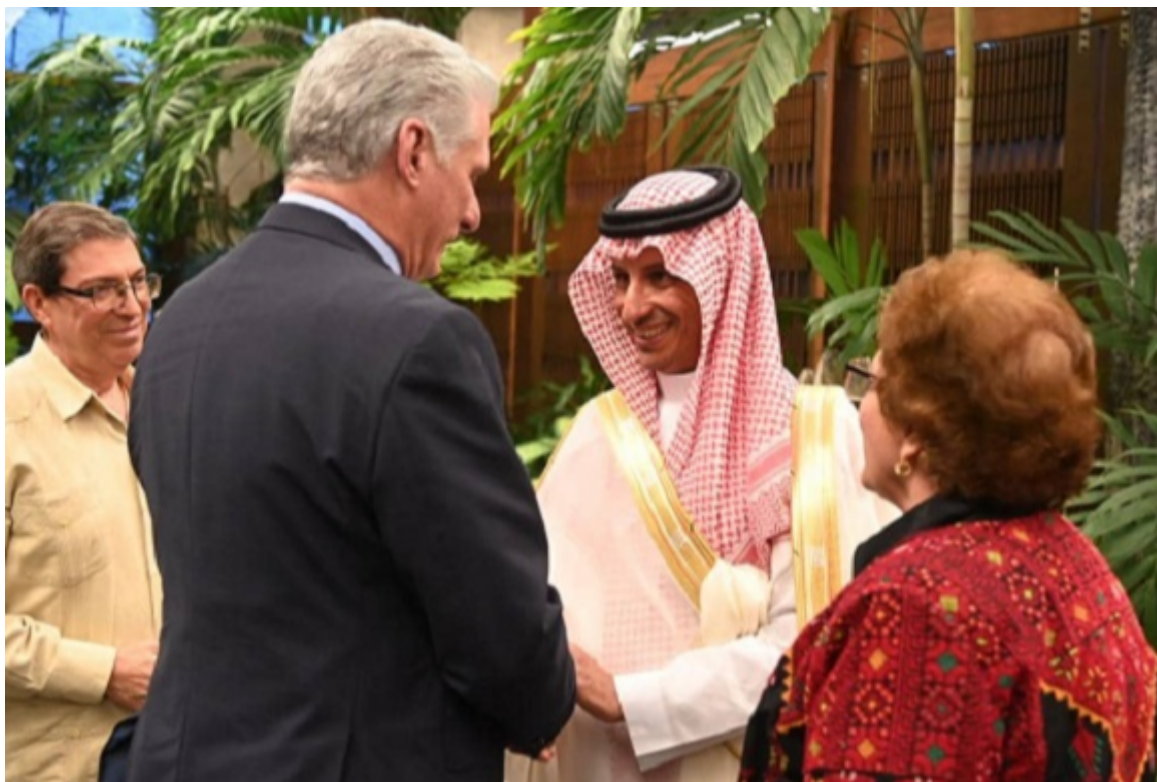
Miguel Díaz-Canel Bermúdez, sostuvo un encuentro este viernes con el ministro de Turismo del Reino de Arabia Saudita, Ahmed Aqeel Al Khateeb.

La Habana, 19 may (RHC) El presidente de Cuba, Miguel Díaz-Canel, sostuvo un encuentro en La Habana este viernes con el ministro de Turismo del Reino de Arabia Saudita, Ahmed Aqeel Al Khateeb.