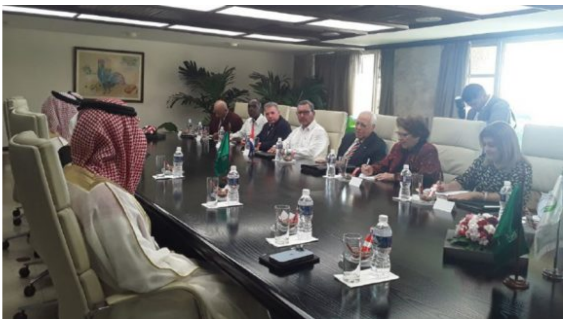
Tras el recibimiento encabezado por el presidente Miguel Díaz-Canel Bermúdez, tuvo lugar hoy un encuentro entre Ricardo Cabrisas Ruíz, vice primer ministro y ministro de Comercio Exterior y la