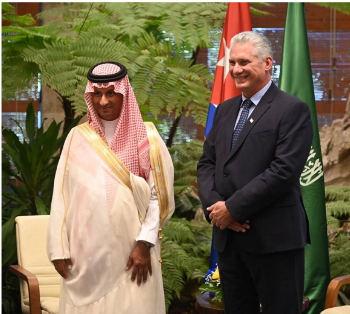
El presidente Miguel Díaz-Canel Bermúdez, sostuvo un encuentro este viernes con el ministro de Turismo del Reino de Arabia Saudita, Ahmed Aqeel Al Khateeb.