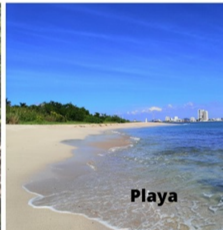
Ecosistemas costeros. Imagen Son Playas

Villa Clara, 22 de mayo (RHC) El VI Taller Nacional de Manejo de Zonas Costeras Centro Costas 2023, sesionará en la provincia cubana de Villa Clara los días 23 y 24 de mayo en el Hotel Grand Aston Cayo Las Brujas, situado en el destino turístico Cayos de Santa María.