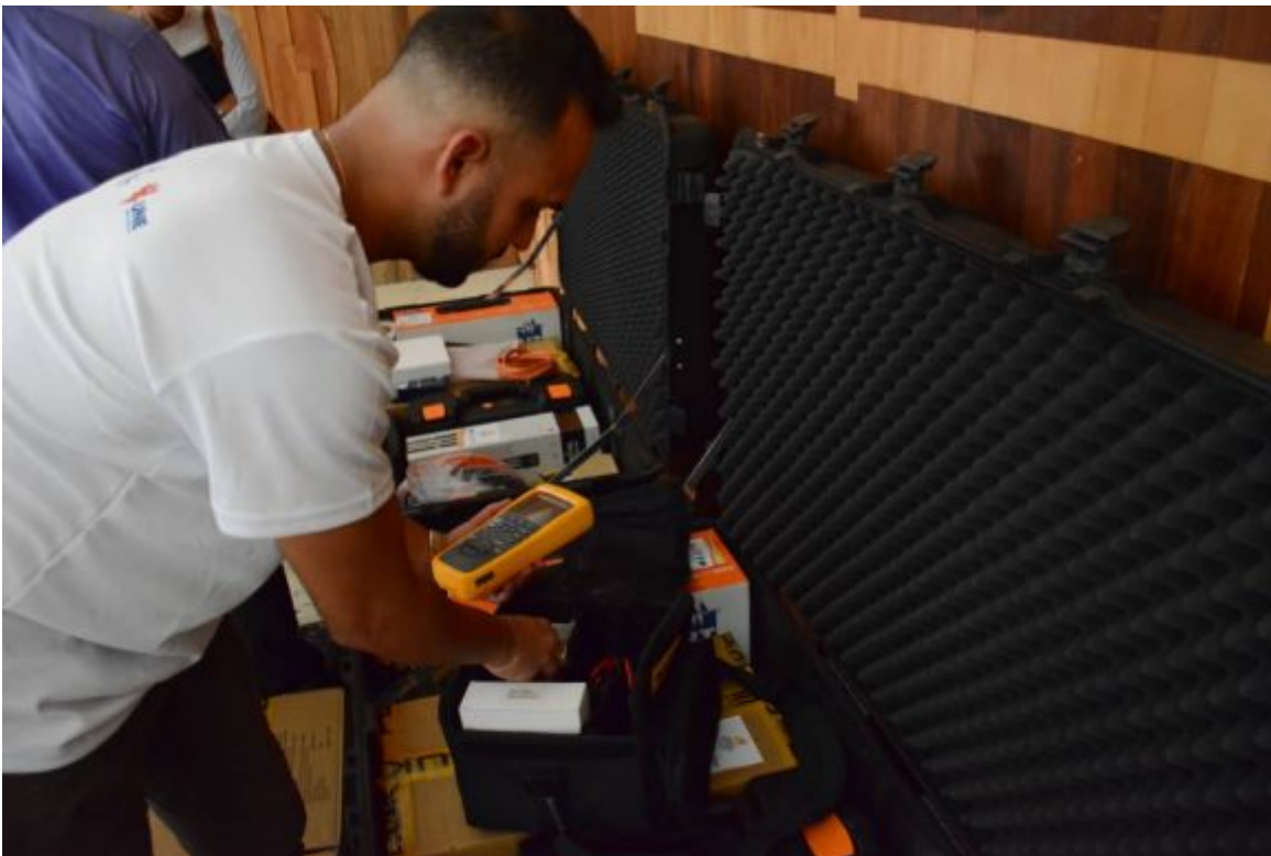
El Proyecto Resiliencia energética posibilitó la instalación de 827 sistemas fotovoltaicos de dos kilovatios en viviendas en zonas rurales de difícil acceso en Villa Clara, Sancti Spíritus, Ciego de Ávila y Camagüey