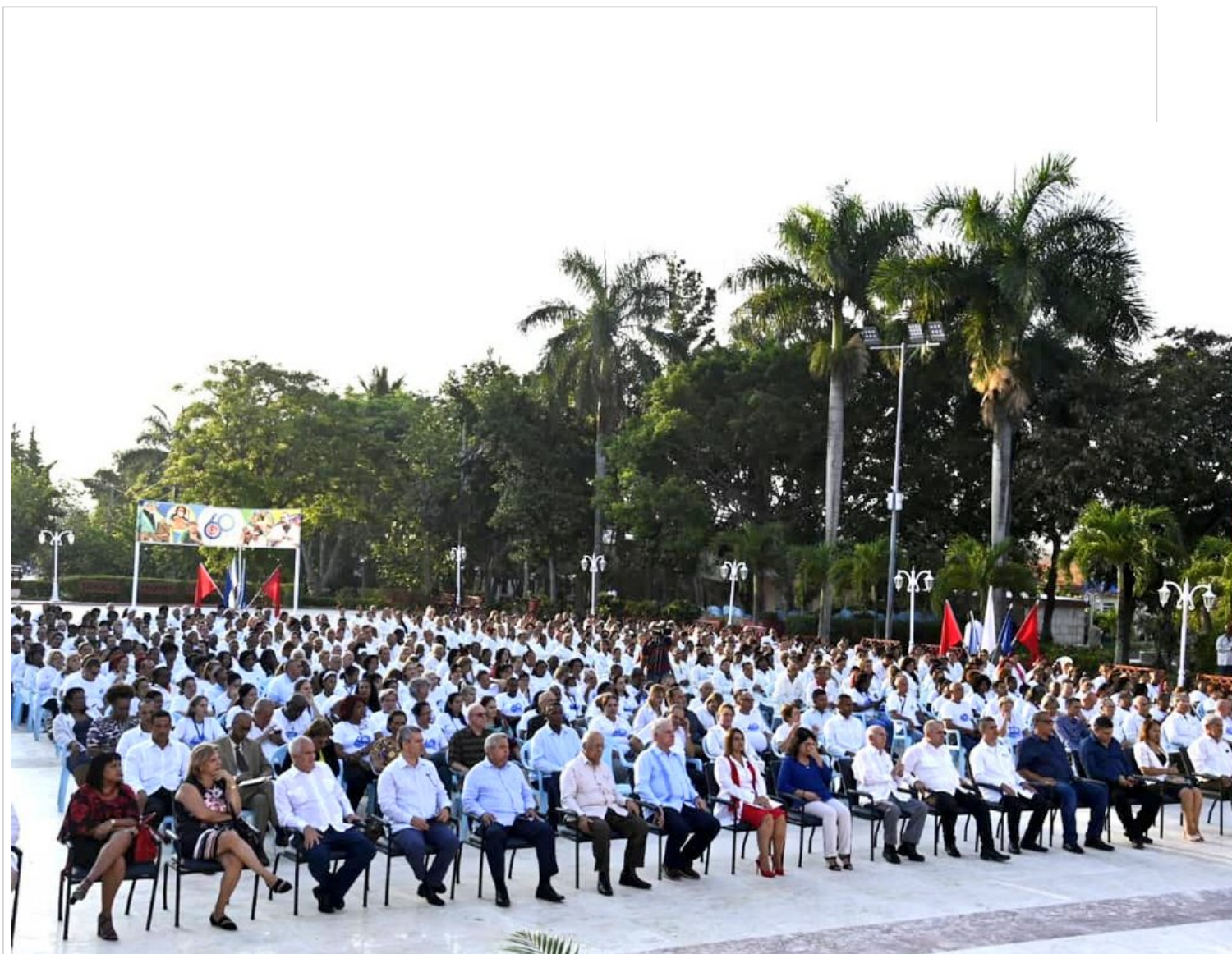
60 años de ininterrumpida lucha por la salud y la vida.

La Habana, 24 may (RHC) El presidente Miguel Díaz-Canel asiste este miércoles al acto por los 60 años de la colaboración médica de Cuba en el mundo, en la que han participado 605 mil profesionales y trabajadores de la salud en 165 países.