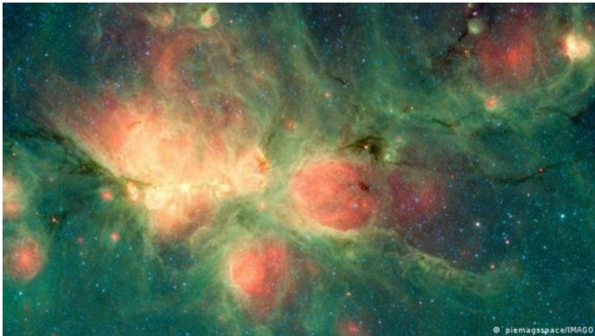
Filamentos negros atravesando la nebulosa de la Pata de Gato. (Imagen de referencia).

Un equipo internacional de astrofísicos ha descubierto unos filamentos ocultos en el centro de la Vía Láctea (a 25.000 años luz de la Tierra), que son muy diferentes de los únicos filamentos que se conocían hasta ahora y que fueron descubiertos en 1984.