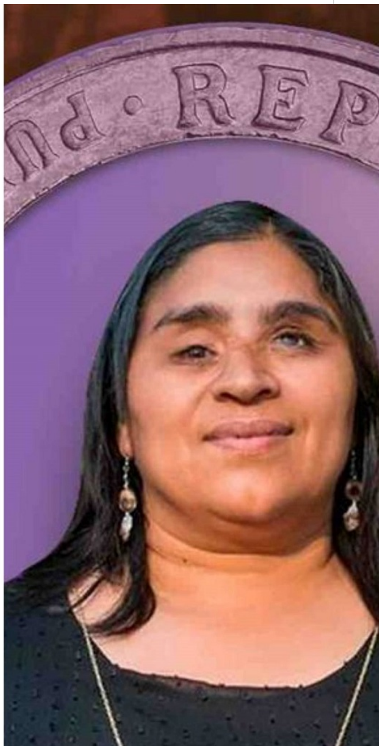
Senadora Fabiola Campillai

Santiago de Chile, 3 jun (RHC) Un tribunal chileno condenó al Estado a pagar una indemnización a la actual senadora Fabiola Campillai, quien sufrió graves lesiones a manos de un carabinero durante el estallido social de 2019, se conoció este sábado.