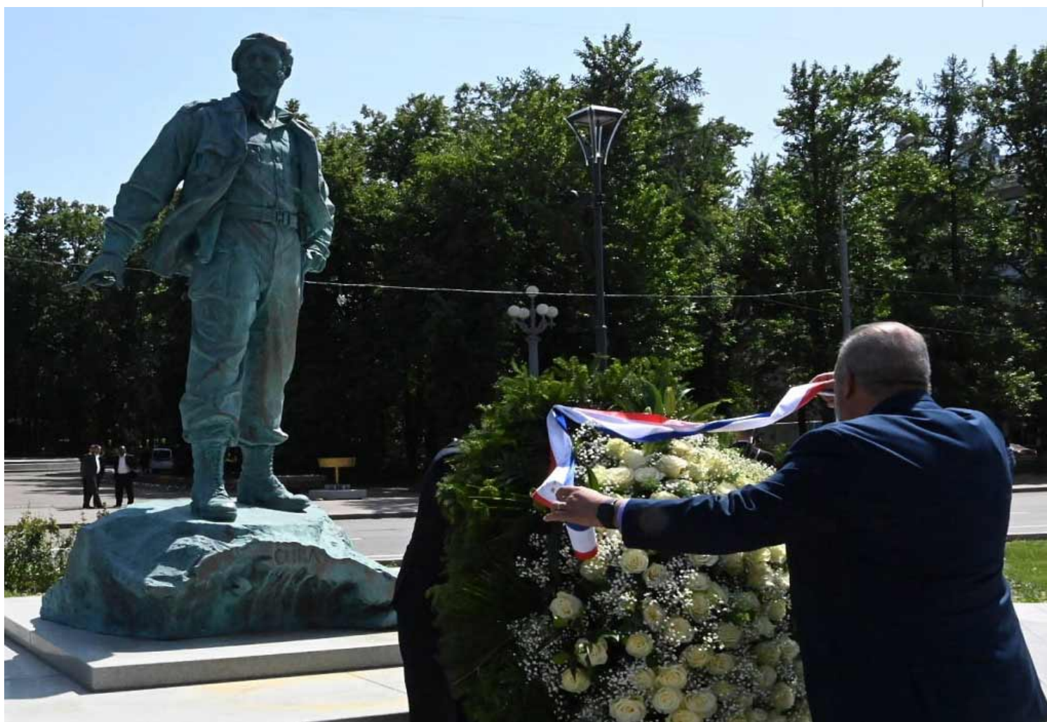
Primer ministro de Cuba frente al monumento erigido al líder histórico de la Revolución Fidel Castro.

Moscú, 12 jun (RHC) El primer ministro de Cuba, Manuel Marrero, rindió este lunes tributo al líder histórico de la Revolución Fidel Castro (1926-2016) en el monumento erigido en su honor en el distrito