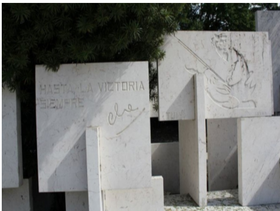
Monumento al Che en el Bosque de los Héroes, Santiago de Cuba.