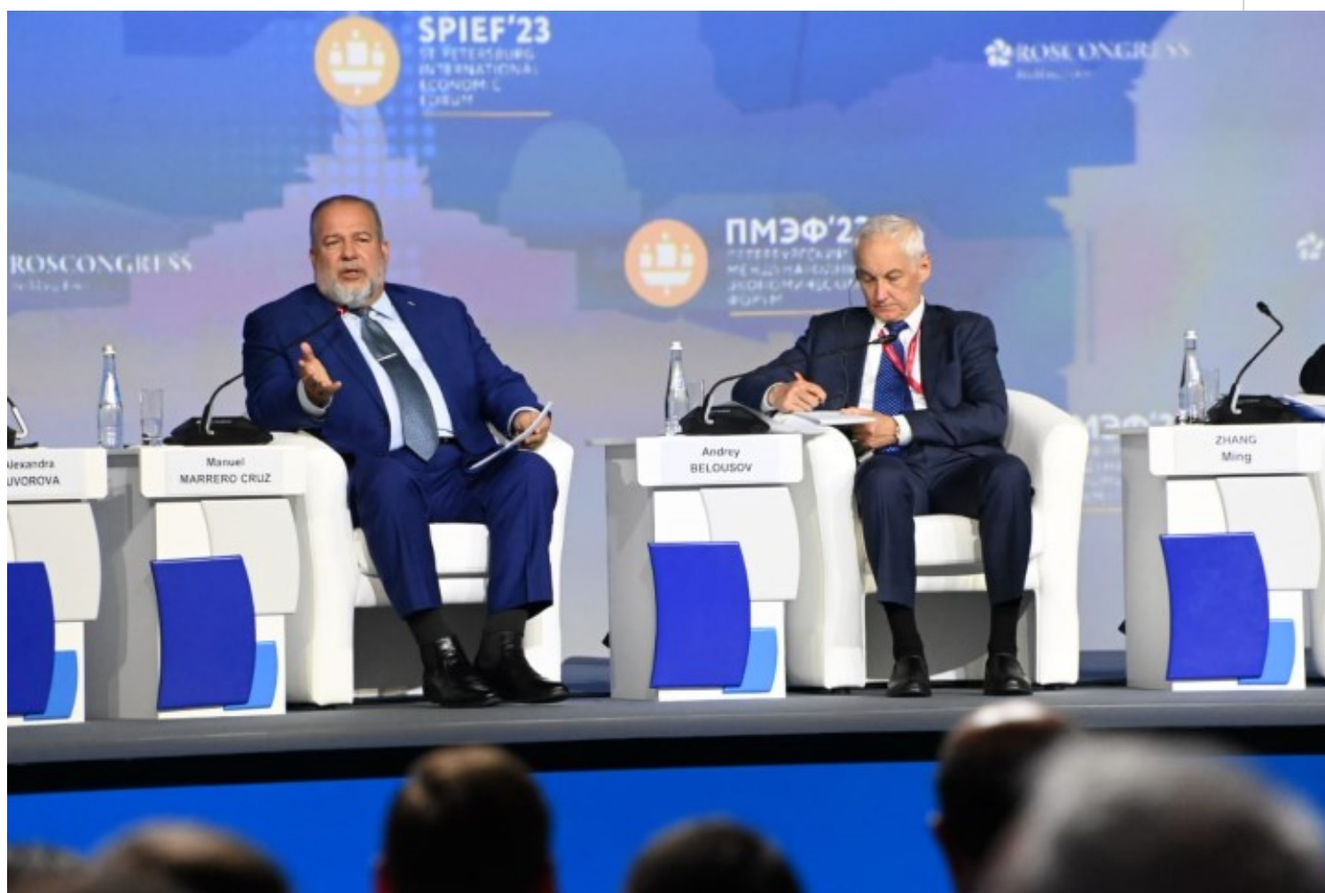
Manuel Marrero durante su intervención en el XXVI Foro Económico Internacional de San Petersburgo (Spief).

San Petersburgo, 15 jun (RHC) El primer ministro de Cuba, Manuel Marrero, resaltó este jueves la posición abierta del país para la inversión extranjera y el reforzamiento de las relaciones económicas con