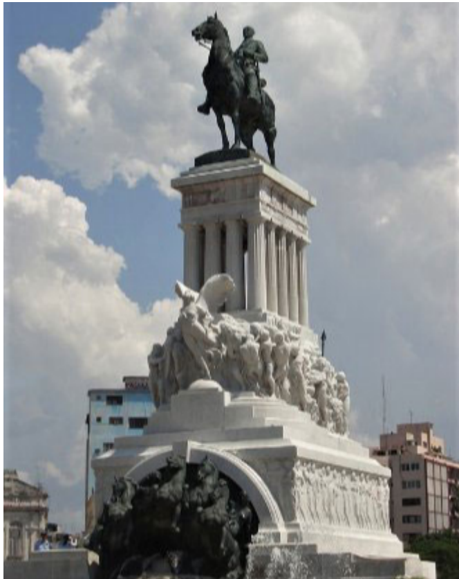
Monument Máximo Gómez

La bataille de Las Guásimas s'est déroulée du 15 au 19 mars 1874, à Camagüey, Cuba. Les forces du brigadier Armiñán, qui comptait trois mille hommes, se sont opposées aux forces cubaines commandées par le général Máximo Gómez.