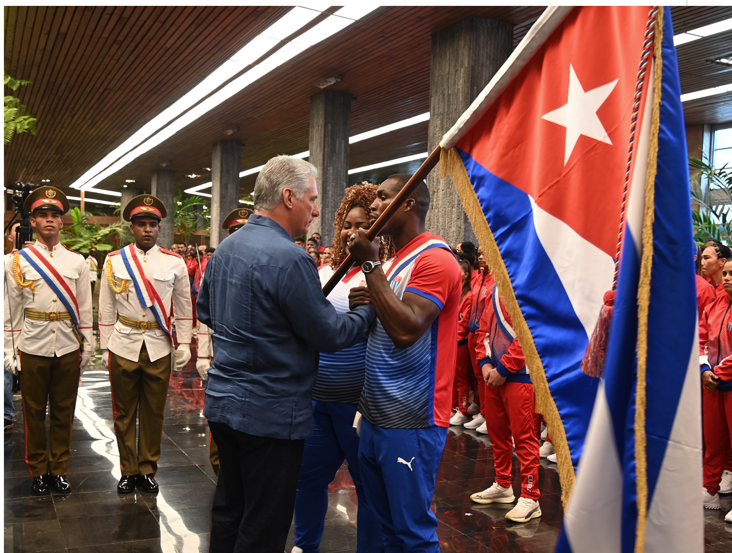
Los mutimedallistas olímpicos y mundiales Julio César La Cruz (boxeo) e Idalis Ortiz (judo) recibieron la enseña nacional