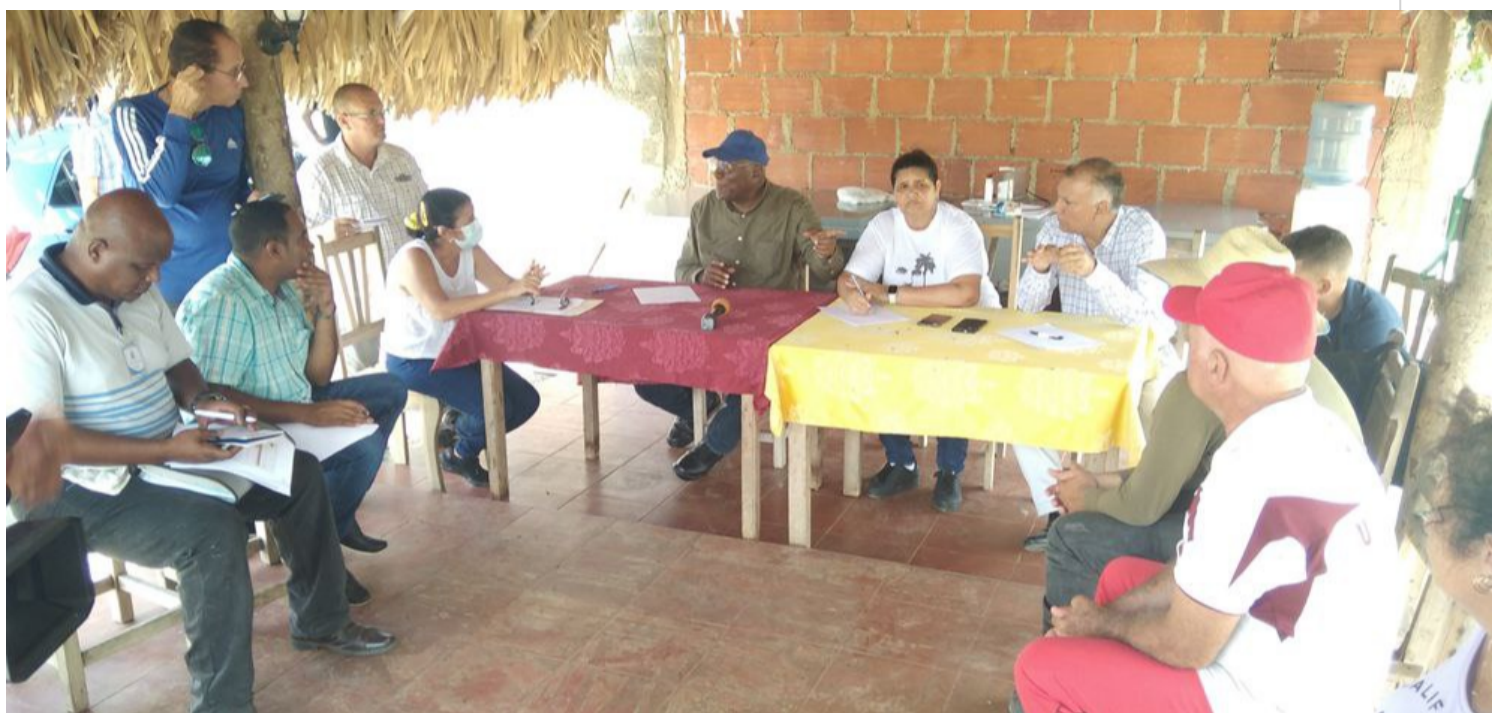
Valdés Mesa en Artemisa.

Artemisa, 17 jun (RHC) Salvador Valdés Mesa, vicepresidente de la República de Cuba, chequeó el programa de producción de huevos para el autoabastecimiento municipal y el quehacer en la Empresa Filial Agropecuaria Central José Martí durante una visita de trabajo a Artemisa.