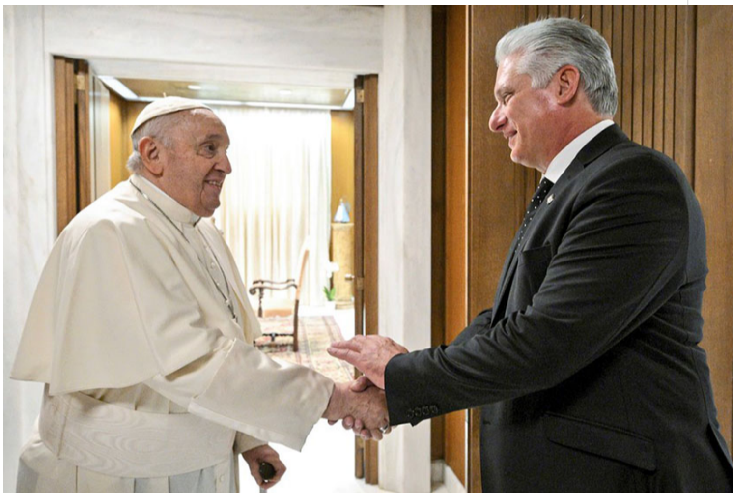
Papa Francisco recibe al presidente de Cuba, Miguel Díaz-Canel.

La Habana, 20 jun (RHC) El Presidente de Cuba, Miguel Díaz-Canel, y el Papa Francisco constataron este martes el positivo estado de las relaciones entre la nación caribeña y la Santa Sede, en una audiencia privada en el Vaticano.