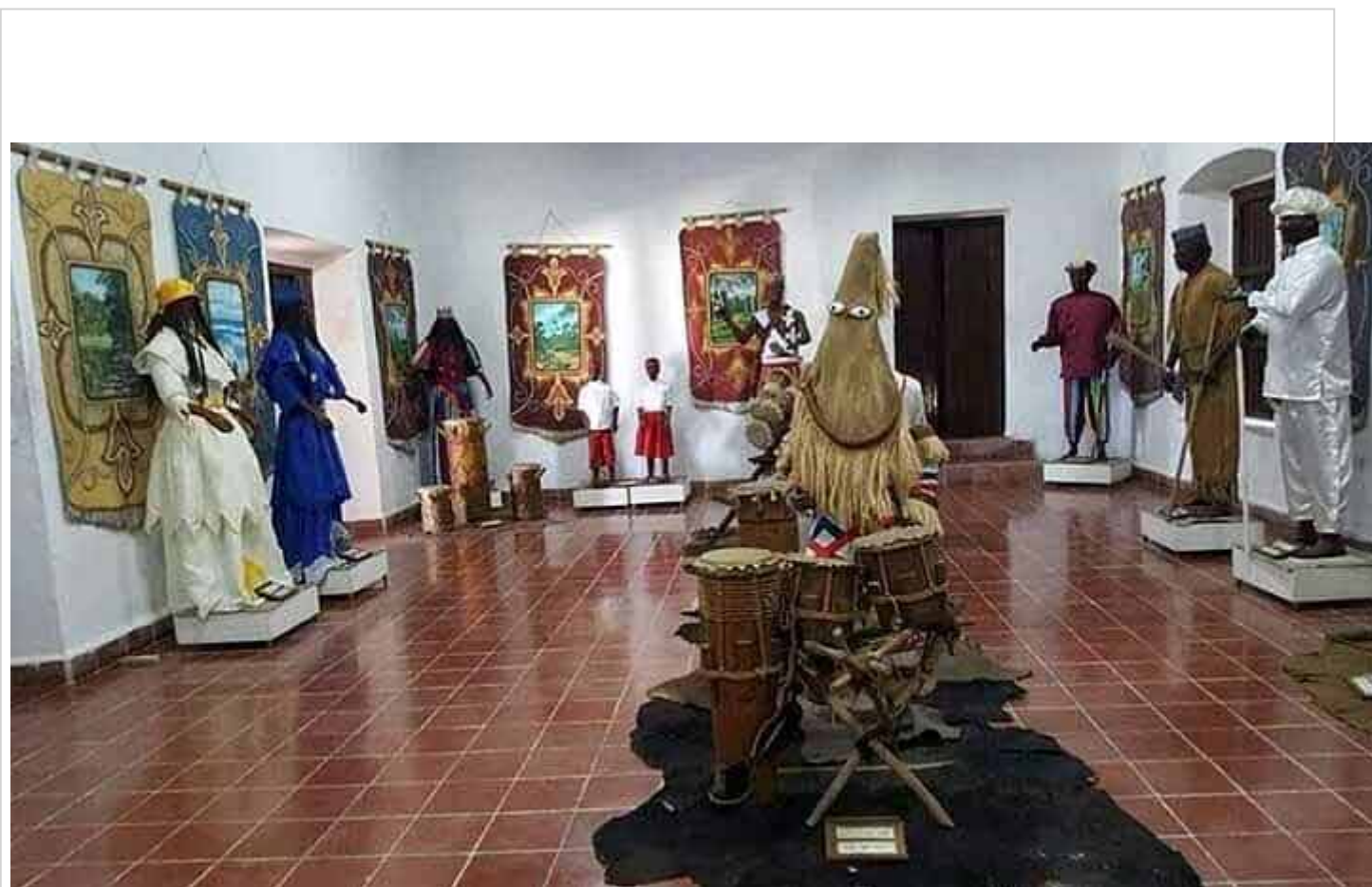
Sala de los Orishas

Matanzas fue uno de los centros esclavistas más importantes de la Isla y el de mayor número de fenómenos asociados al cimarronaje y el apalencamiento.