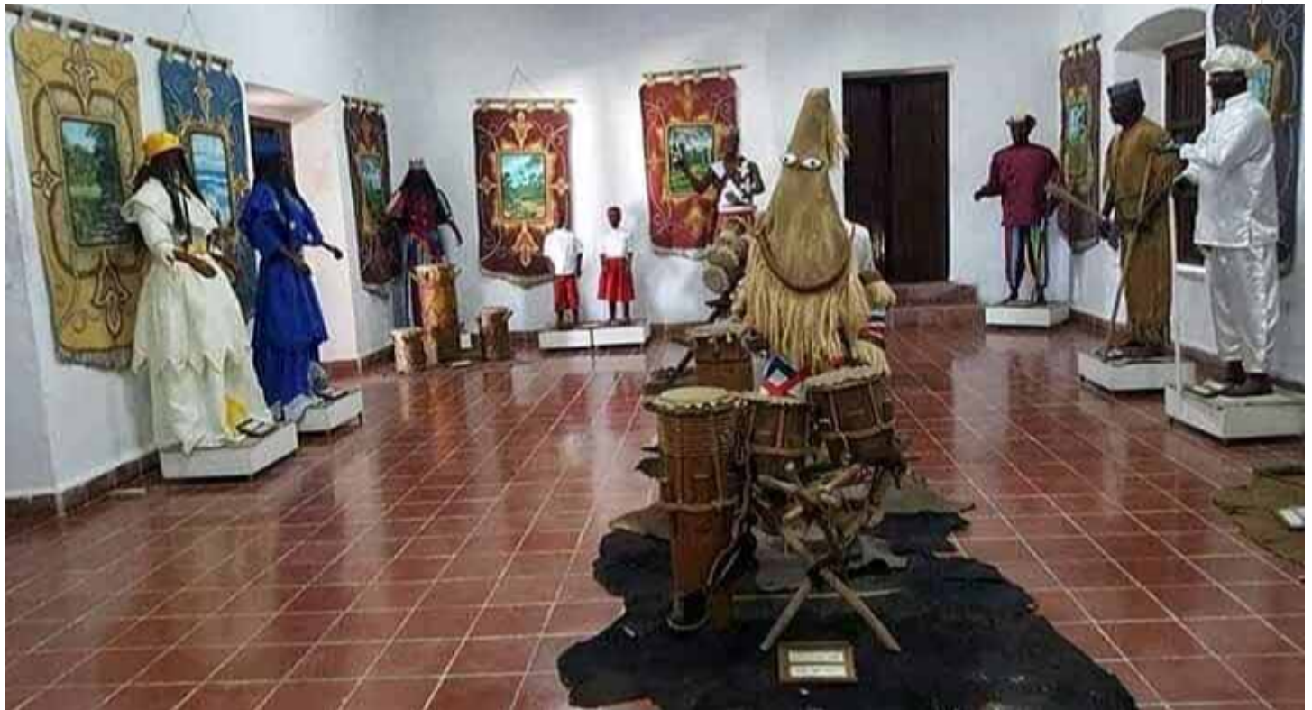
Salle des Orishas

Matanzas a été l'un des centres d'esclavage les plus importants de l'île et celui où l'on trouve le plus grand nombre de phénomènes liés au marronnage et à la traite des esclaves.