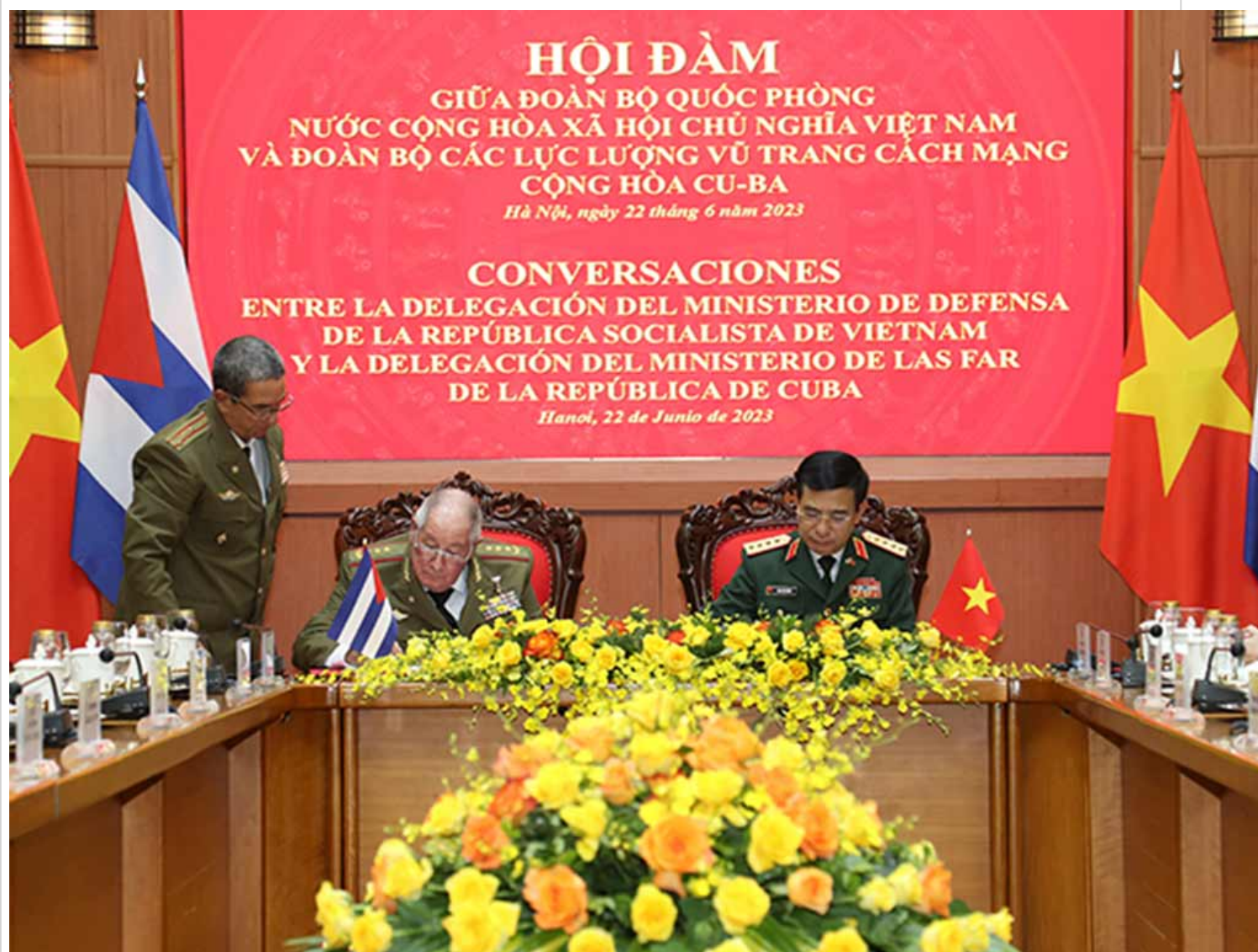
Ministros de Defensa de Cuba y Vietnam, Álvaro López Miera y Phan Van Giang.

Hanoi, 23 jun (RHC) Los lazos en el ámbito de la defensa constituyen uno de los pilares de las relaciones binacionales y un ejemplo para impulsar la cooperación en otros sectores, señalaron altos mandos de Vietnam y Cuba.