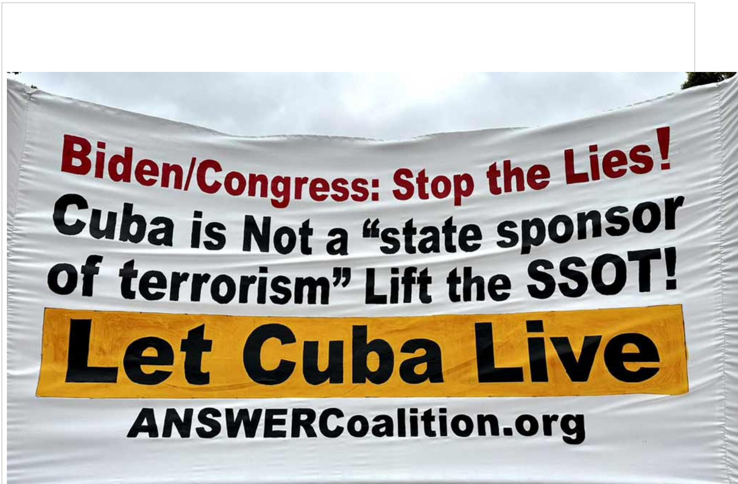
Frente a la Casa Blanca se manifiestan por Cuba.

Washington, 25 jun (RHC) Con una marcha y concentración frente a la Casa Blanca concluye este domingo una semana de solidaridad con Cuba que tendrá expresiones en más de 30 ciudades de Estados Unidos y en otras partes del mundo.