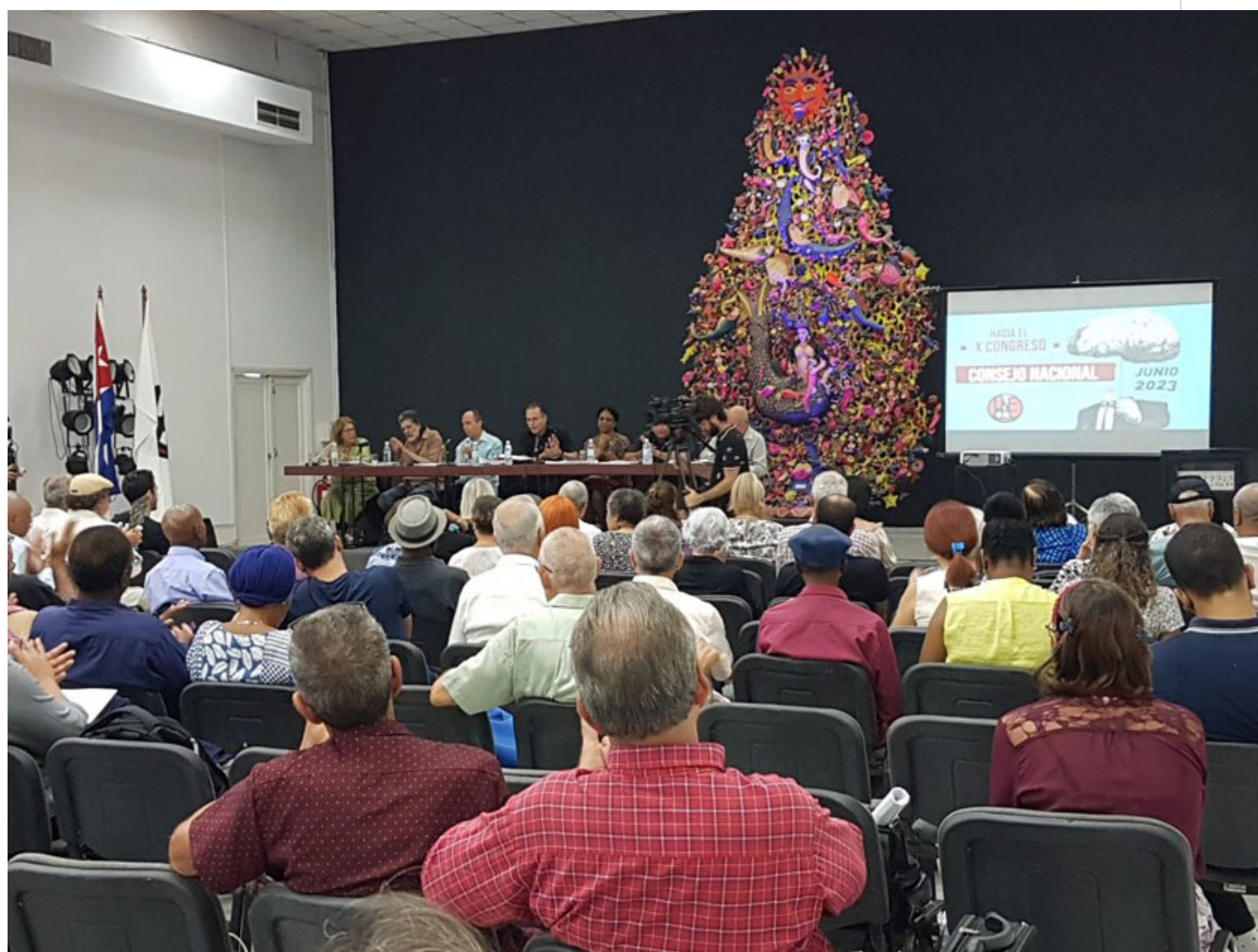
Consejo Nacional de la Unión de Escritores y Artistas de Cuba.