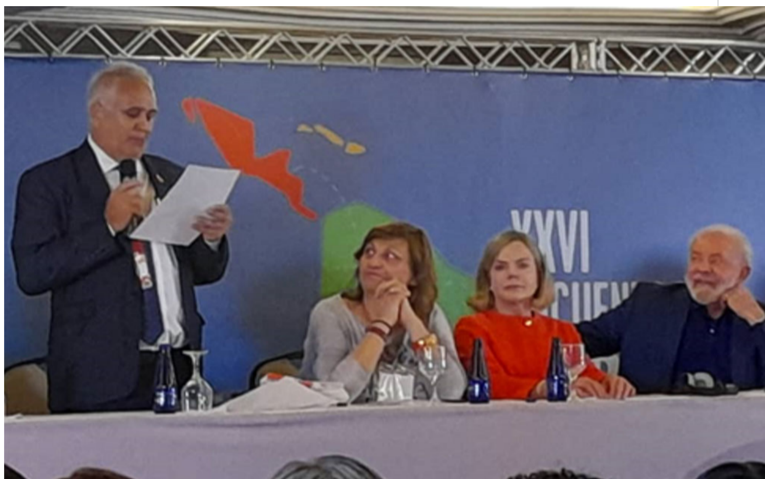
Cuba denuncia en Foro de Sao Paulo bloqueo estadounidense.

Brasilia, 30 jun (RHC) Una contundente denuncia contra el bloqueo de Estados Unidos, que gravita hoy más que nunca sobre Cuba, afloró en el XXVI Encuentro del Foro de Sao Paulo, que sesiona en esta capital hasta el próximo domingo.