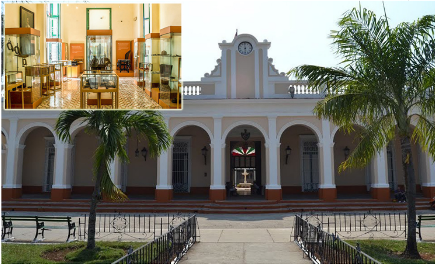
Museo Oscar María de Rojas

El Museo Municipal de Cárdenas Oscar María de Rojas fue la primera edificación construida en esa localidad para atesorar las muestras museables existentes y fungir como biblioteca pública. Atesora importantes colecciones de historia, armas, documentos, artes plásticas, ciencias naturales, numismática, arqueología y artes decorativas.