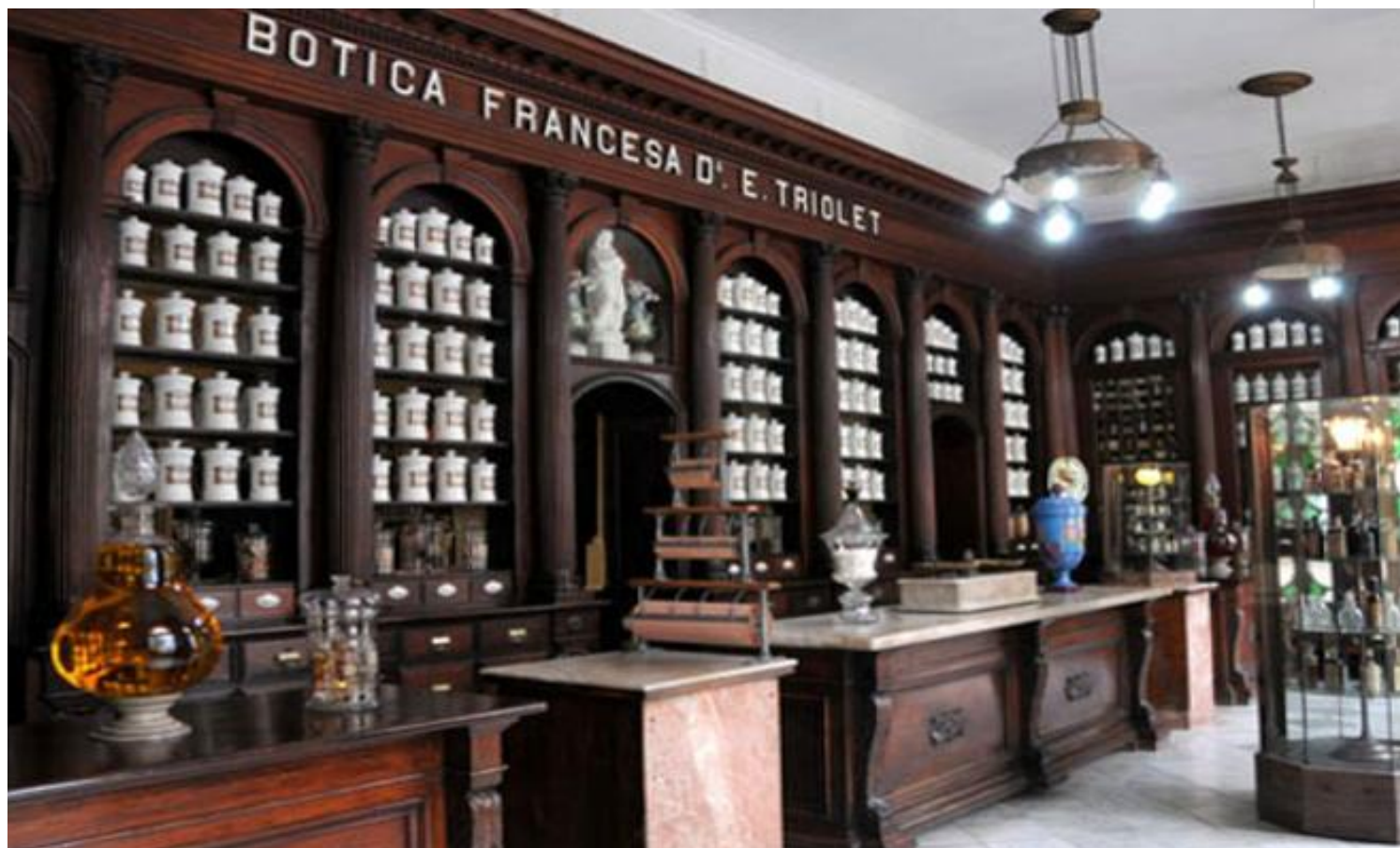
Museo Farmacéutico de Matanzas

Museo Farmacéutico de Matanzas: donde la historia convida