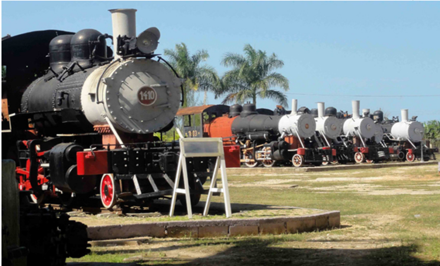
Museo José Smith Comas, de Cárdenas, Historia del azúcar

El museo José Smith Comas, de Cárdenas. Valiosas piezas entretienen la historia del azúcar en Cuba. En la institución se resguardan dos locomotoras de procedencia alemana, y varias americanas que datan de 1895 y hasta 1925. Se encuentra representado, además, un proceso de obtención del azúcar con casi todos sus componentes. (Tomado del Portal de la Atena de Cuba)