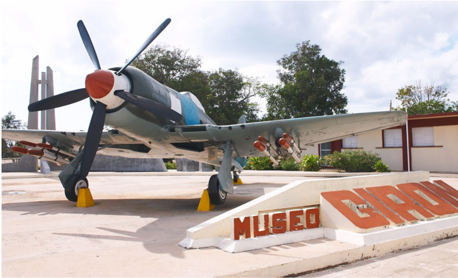
Museo Playa Girón

En el Museo de Playa Girón resuenan los ecos de la batalla acaecida en ese lugar, donde el imperialismo sufrió su primera gran derrota en América latina. La instalación está compuesta por dos salas que encierran fotografías y objetos de gran interés, especialmente un mural de víctimas y un muestrario de lo que quedó de sus pertenencias. En el exterior se muestra parte del armamento empleado en la contienda.