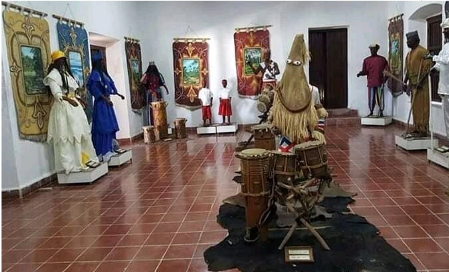
Museo la Ruta del esclavo en Matanzas

El Museo Nacional de la Ruta del Esclavo radica en el otrora Castillo de San Severino desde el 16 de junio de 2009, resultado de un proyecto que surgió como iniciativa de Haití y otros países de herencia africana en el que tomó parte la Unesco. Consta de cuatro salas expositivas, testigos de la brutalidad a que fueron sometidos esos hombres y mujeres.