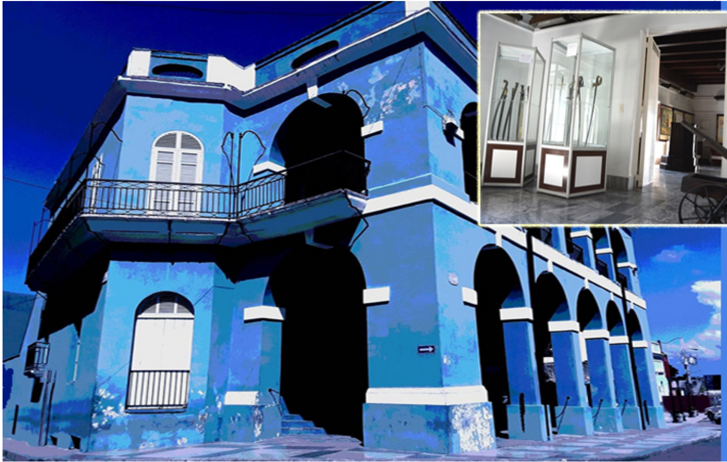
Museo Histórico de Matanzas

El museo histórico de Matanzas, creado en septiembre de 1959, trasciende como el primero de los museos fundado por la Revolución Cubana. Institución que en la década del 80 del siglo XX se convierte en museo provincial Palacio de Junco y ocupa desde entonces su sede actual en el entorno de la Plaza de La Vigía.