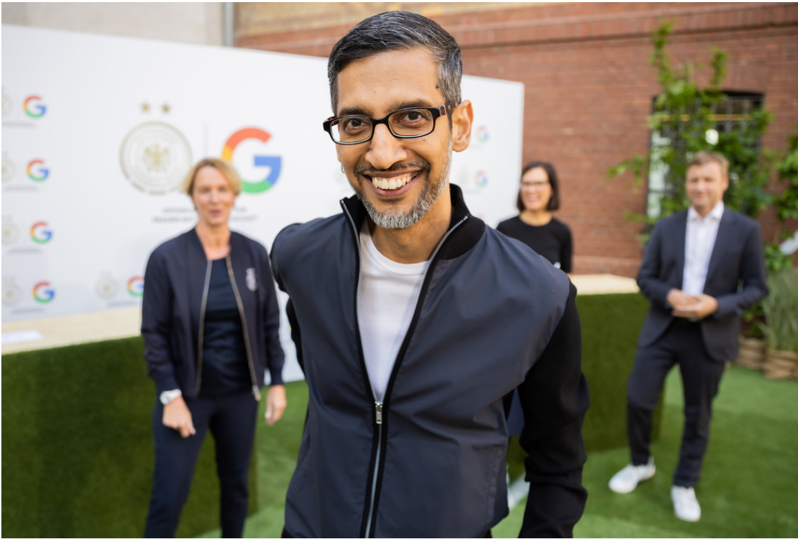
El director ejecutivo de Google, Sundar Pichai

Retado con un grupo de tareas que requerían de cualidades sobrehumanas para su solución inmediata, el algoritmo sorprendió constantemente al presentador con sus respuestas.